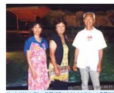
ゆったりとした楽しい時間が過ごせました!ボホール島観光ではロボク川クルーズで気分爽快、良い思い出が出来ました

おととしに続き2回目のセブへ行く実現となりました。2回目なので、1回目に行けなかったボホール島やバディアンゴルフリゾートに1泊し、パンダノン島にも行くことができ大満足でした。ゴージャスな部屋、マンゴジュース、やさしいドライバー、ガイドさん、メイドさんに出迎えられ、5泊6日のセブ旅行スタートです。日本では考えられない物価の安さに、つついとお土産が多くなりました。ゴールデンカウリでのフィリピン料理が美味しかったです。ボホール島の世界一小さいお猿のターシャのかわいらしさ、チョコレートヒルの大自然の雄大さ、ロボク川クルーズでのバイキングを食べながら大胆にも踊って気分爽快になりました。ツアーと違って、自分でスケジュールが組み、時間にしばられなく大自然と同じゆったりとした楽しい時間が過ごせました。大自然だけでなく、私達を出迎えてくれた、ドライバーさん、ガイドさん、メイドさん達の心配りなども大きな力になってくれていると思いました。同行した中に、前の日に少しケガをした人がいて、心配していたのですが、気遣ってくれてありがとうございました。お陰で無事帰ることができ、又良い思い出が出来ました。みなさん本当に、ありがとうございました。