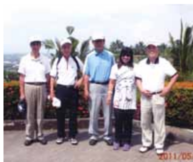
パンダノン、ボホールと島巡りも満喫!きれいな海で船の往復も楽しく、リラックスできた9日間でした