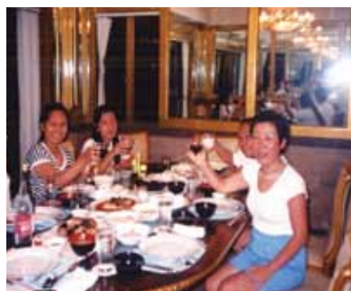
3度目、8泊9日の旅!スペシャルビラのテラスで大富豪の気分を満喫、敷地内には南国の花々が咲き乱れ感動でした