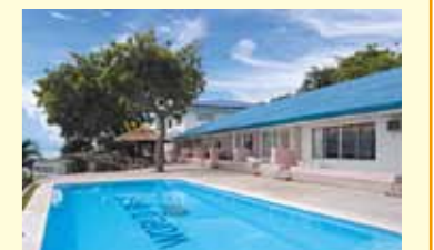
バディアンゴルフリゾート

URL http://www.jwbhotel.jp TEL 03(5817)0705