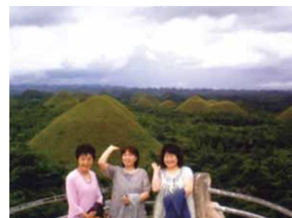
はじめてのセブ島、楽しい南国の旅でした!近くの島へ行き、シュノーケリングも満喫、ず〜っと泳いでいても飽きる事はありませんでした

初めてセブ島へ行きました。空港に着いたのは夜だったため、景色はわかりませんでした。翌日の朝、コーラルポイントリゾート6階から見た青い海がとてもキレイで感激しました。朝食にはいつも、マンゴやパイナップル、バナナがあり、南国の果物はどれも熟していて、生で食べても、ジュースでもおいしかったです。日本ではとても味わうことができません。セブ島では時間がゆっくり流れていて、一日がとても長く感じました。近くの島へ行き、シュノーケリングを楽しみました。ウニやヒトデ、きれいな魚がいて、ず〜っと泳いでいても飽きる事はありませんでした。機会があれば、スキューバダイビングでもっと深く潜ってたくさんの魚を見てみたいです。夜、客室の洗面所の窓の外にヤモリが・・・6階にまであがってくるなんて、びっくりしました。ハチュウ類は苦手です。見ていると、明るい所にくる虫を探していました。次の日も同じ場所にきていました。旅行の最後の日の夜にはいませんでした。毎晩遊びに来ていたので、妙にかわいく思い、ちょっとさみしい気持ちになりました。ハチュウ類は苦手なのに。セブ島には日本食もあり、夕食はラーメンを食べながらNHKのテレビを見ていた時、一瞬日本にいるのかと思ってしまいました。おいしかったです「ラーメン亀吉」4泊5日の旅行。楽しい南国の旅でした。