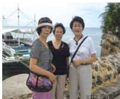
会員さんと夢のような日々を過ごさせて頂きました!無人島では新鮮な食材のバーベキューを堪能、水着姿でいただいた味は一生忘れません