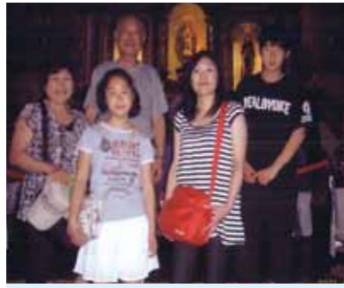
「ただいま!」そんな気分で始まったセブ家族旅行!マリンスポーツにショッピング、島巡り等を満喫、ありがとうセブスタッフ