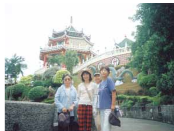
2回目のセブ旅行!ボホール島やバディアンゴルフリゾートに1泊し、パンダノン島にも行くことができ大満足でした

おととしに続き2回目のセブへ行く実現となりました。2回目なので、1回目に行けなかったボホール島やバディアンゴルフリゾートに1泊し、パンダノン島にも行くことができ大満足でした。ゴージャスな部屋、マンゴジュース、やさしいドライバー、ガイドさん、メイドさんに出迎えられ、5泊6日のセブ旅行スタートです。日本では考えられない物価の安さに、つついとお土産が多くなりました。ゴールデンカウリでのフィリピン料理が美味しかったです。ボホール島の世界一小さいお猿のターシャのかわいらしさ、チョコレートヒルの大自然の雄大さ、ロボク川クルーズでのバイキングを食べながら大胆にも踊って気分爽快になりました。ツアーと違って、自分でスケジュールが組み、時間にしばられなく大自然と同じゆったりとした楽しい時間が過ごせました。大自然だけでなく、私達を出迎えてくれた、ドライバーさん、ガイドさん、メイドさん達の心配りなども大きな力になってくれていると思いました。同行した中に、前の日に少しケガをした人がいて、心配していたのですが、気遣ってくれてありがとうございました。お陰で無事帰ることができ、又良い思い出が出来ました。みなさん本当に、ありがとうございました。