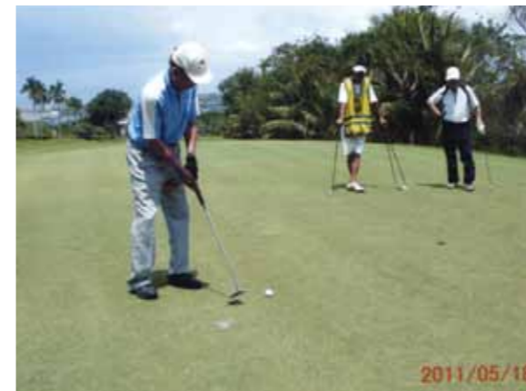
初めてのセブ島でゴルフを満喫!4ヵ所のコースをまわりましたが、それぞれ特徴がありかなりのレベルのものでした

5月16日夜7時に友人3人と名古屋から香港経由でセブ空港に着き、迎えのガイドさんとコーラルポイントリゾートへ。大富豪の別荘だけあり部屋もビューも申し分なし。翌日からゴルフをメインにしたツアーをスタート。ゴルフ場は正直言ってハワイなどと比べてあまり期待はしていなかったものの、4ヵ所のコースをまわりましたが、それぞれ特徴がありかなりのレベルのものでした。特に2度目に訪れたアルタビスタCCはコースの状態、レイアウトもかなりのもので、何よりも高台にあり、眺望が海を見下ろす絶景コースでした。セブの名門コース、セブカントリーは歴史を感じさせる風格を感じさせられるグレードの高いコースでした。いずれも池、クリークが随所にあり、皆さんかなりのボールを献上していましたし、芝目がきつくグリーンでも大苦戦でした。ゴルフの合間にはボホール島観光、無人島でのBBQなど親切なガイドさん、運転手さんがずっと付いてくれて大いにENJOYできました。メイドさん達も大変フレンドリーで洗濯、朝食などテキパキと実に良く面倒を見てくれ、あらためてフィリピンの人々のホスピタリティーが世界的にも評価されていることを実感しました。帰国前夜には同宿されていた信州の14名の方々とメイドさん20名と共にバンドを入れて賑やかなフェアウェルパーティーを歌い踊りで締めくくりました。充実した素晴らしい9日間でした。又お世話になった現地の方々の再会をいつの日か期待しています。