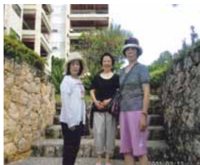
忘れられない夢のような思い出が出来ました!大盛り上がりのサヨナラパーティーでは夜の更けるのも忘れる程の楽しさでした