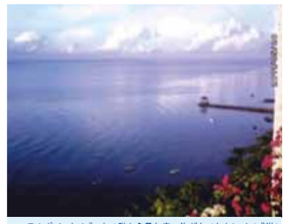
コーラルポイントリゾート6階から見た青い海がとてもキレイで感激!セブ島では時間がゆっくり流れていて、一日がとても長く感じました

初めてセブ島へ行きました。空港に着いたのは夜だったため、景色はわかりませんでした。翌日の朝、コーラルポイントリゾート6階から見た青い海がとてもキレイで感激しました。朝食にはいつも、マンゴやパイナップル、バナナがあり、南国の果物はどれも熟していて、生で食べても、ジュースでもおいしかったです。日本ではとても味わうことができません。セブ島では時間がゆっくり流れていて、一日がとても長く感じました。近くの島へ行き、シュノーケリングを楽しみました。ウニやヒトデ、きれいな魚がいて、ず〜っと泳いでいても飽きる事はありませんでした。機会があれば、スキューバダイビングでもっと深く潜ってたくさんの魚を見てみたいです。夜、客室の洗面所の窓の外にヤモリが・・・6階にまであがってくるなんて、びっくりしました。ハチュウ類は苦手です。見ていると、明るい所にくる虫を探していました。次の日も同じ場所にきていました。旅行の最後の日の夜にはいませんでした。毎晩遊びに来ていたので、妙にかわいく思い、ちょっとさみしい気持ちになりました。ハチュウ類は苦手なのに。セブ島には日本食もあり、夕食はラーメンを食べながらNHKのテレビを見ていた時、一瞬日本にいるのかと思ってしまいました。おいしかったです「ラーメン亀吉」4泊5日の旅行。楽しい南国の旅でした。