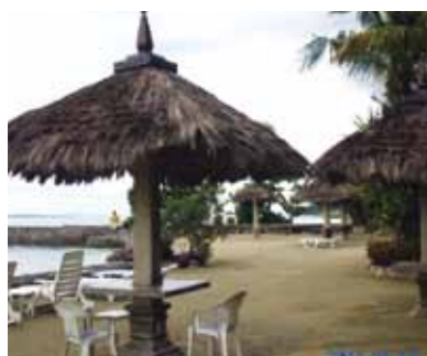
青いきれいな海と、どこに行ってもブーゲンビリアの花が咲いていて本当に楽しい旅でした!皆さん有難うございました