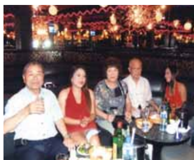
バディアンゴルフリゾートではカラオケ三昧!カガミ張りのスナックでもカラオケを楽しみました