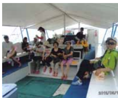
白い砂浜の島へ行き綺麗な海に感激!ゴーグル、シュノーケルでもっと海の中を探検したかったです