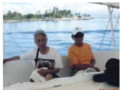
ボホール島観光、無人島でのBBQなども満喫!帰国前夜にはフェアウェルパーティー、充実した素晴らしい9日間でした

5月16日夜7時に友人3人と名古屋から香港経由でセブ空港に着き、迎えのガイドさんとコーラルポイントリゾートへ。大富豪の別荘だけあり部屋もビューも申し分なし。翌日からゴルフをメインにしたツアーをスタート。ゴルフ場は正直言ってハワイなどと比べてあまり期待はしていなかったものの、4ヵ所のコースをまわりましたが、それぞれ特徴がありかなりのレベルのものでした。特に2度目に訪れたアルタビスタCCはコースの状態、レイアウトもかなりのもので、何よりも高台にあり、眺望が海を見下ろす絶景コースでした。セブの名門コース、セブカントリーは歴史を感じさせる風格を感じさせられるグレードの高いコースでした。いずれも池、クリークが随所にあり、皆さんかなりのボールを献上していましたし、芝目がきつくグリーンでも大苦戦でした。ゴルフの合間にはボホール島観光、無人島でのBBQなど親切なガイドさん、運転手さんがずっと付いてくれて大いにENJOYできました。メイドさん達も大変フレンドリーで洗濯、朝食などテキパキと実に良く面倒を見てくれ、あらためてフィリピンの人々のホスピタリティーが世界的にも評価されていることを実感しました。帰国前夜には同宿されていた信州の14名の方々とメイドさん20名と共にバンドを入れて賑やかなフェアウェルパーティーを歌い踊りで締めくくりました。充実した素晴らしい9日間でした。又お世話になった現地の方々の再会をいつの日か期待しています。