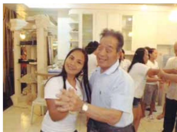
セブの気候の暖かさにびっくり!ボホール島では、ターシャ、チョコレートヒルの見学、ロボク川クルーズ船上バイキングを楽しみました

若い頃役員をして外国には時々行きましたが、今回の様にゆっくりの旅は初めてです。セブ・マクタン空港に着いた時、気候の暖かさにはびっくりでした。コーラルポイントリゾートではA棟6階に宿泊する事ができました。昼はイタリア料理、夜は海を眺めながらJWBホテルの夕食おいしかったです。バディアンゴルフリゾートでは海に入ったりプールで泳ぎました。夜は大好きなカラオケで盛り上がりました。カワサン滝では心も体も洗われました。夕食は日本食のお店で飲みなれたお酒を飲み、疲れも飛んでしまいました。ボホール島では、かわいいターシャを見たり、チョコレートヒルの見学、ロボク川クルーズでは船上バイキングがとってもおいしかったです。お土産をたくさん買い重かったです。又機会があれば行ってみたいです。ガイドさん、運転手さん、メイドさんお世話になりました。