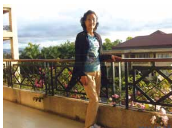
初めての海外旅行は胸がワクワク感動旅行!私にとって一生思い出に残る楽しい旅でした

私にとって初めての海外旅行で、見る物すべてめずらしく胸がワクワクしました。話には聞いていましたが、実際に来てみてとても感動しました。青いきれいな海と、どこに行ってもブーゲンビリアの花が咲いていて・・・又初めてバナナの花も見ました。本当に楽しい旅でした。ガイドのリサさん、ドライバーの方、メイドさん、又一緒に行かれた皆さんにとっても親切にしてください、私にとって一生思い出に残る楽しい旅でした。皆さん有難うございました。