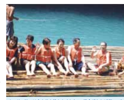
カワサン滝では心も体も洗われました!又機会があれば行ってみたいです。ガイドさん、運転手さん、メイドさんお世話になりました

若い頃役員をして外国には時々行きましたが、今回の様にゆっくりの旅は初めてです。セブ・マクタン空港に着いた時、気候の暖かさにはびっくりでした。コーラルポイントリゾートではA棟6階に宿泊する事ができました。昼はイタリア料理、夜は海を眺めながらJWBホテルの夕食おいしかったです。バディアンゴルフリゾートでは海に入ったりプールで泳ぎました。夜は大好きなカラオケで盛り上がりました。カワサン滝では心も体も洗われました。夕食は日本食のお店で飲みなれたお酒を飲み、疲れも飛んでしまいました。ボホール島では、かわいいターシャを見たり、チョコレートヒルの見学、ロボク川クルーズでは船上バイキングがとってもおいしかったです。お土産をたくさん買い重かったです。又機会があれば行ってみたいです。ガイドさん、運転手さん、メイドさんお世話になりました。