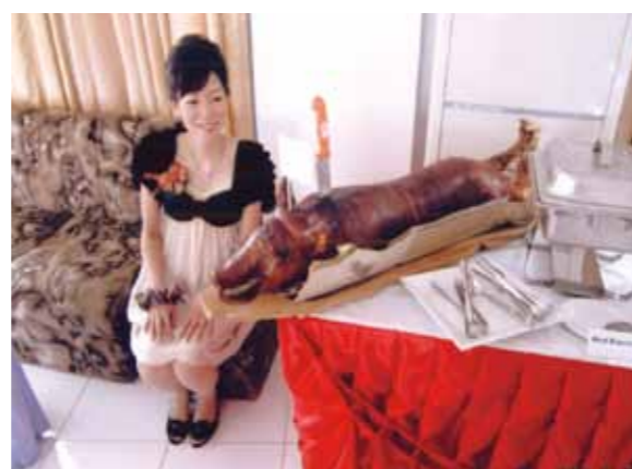
Happy Wedding! 妹の挙式披露宴では仔豚の丸焼きにビックリ! 日本では味わえないセブ島ならではの結婚式を楽しむことができました

Happy Wedding! 妹の挙式披露宴では仔豚の丸焼きが出てきたり、ダンサー達によるショーがあったり、ちょっとしたハプニングもありましたが、日本では味わえないセブ島ならではの結婚式を楽しむことができました。念願だったシーウォーカーでは想像以上の魚たちが集まってきました。あんなにたくさんの魚たちと触れ合える経験はなかなかできないですね。他にもパラセーリングなど初めての経験ばかりで全てが新鮮でした。さよならパーティーではクールなドライバーさんたちが一変!? ステキなダンスを披露してくれて、み〜んなで踊って騒ぎ疲れるほど楽しみました。メイドさん、ガイドさん、ドライバーさんたちはいつもニコニコ笑顔で接してくれ、心が温かくなりました。不自由なく過ごすことができたのはスタッフの皆さんのおかげです。ありがとうございました。また行きたいです! 今回は遊ぶ時間があまりなかったので、次回セブ島に行くときはもっともっと楽しみたいと思います。