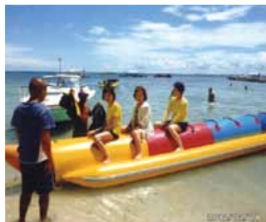
島巡りやマリンスポーツを満喫! 最高に楽しかったパラセーリング、シーウォーカーでは夢の様な体験を堪能しました