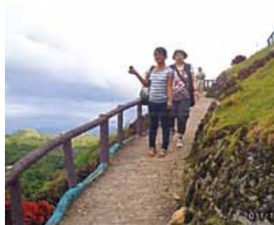
ボホール島では「眼鏡猿のターシャ」いつかは見たいと思っていたので感激!チョコレートヒルの山々が奇観で珍しい景色でした