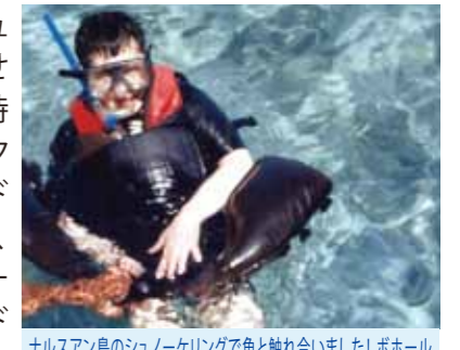
ナルスアン島のシュノーケリングで魚と触れ合いました! ボホール島ではチョコレートヒルや可愛いターシャにもご対面、楽しみました

この度4泊5日というスケジュールで初めてセブ島へ行かせて頂きました。成田空港を定時に出発、予定通りにセブ・マクタン空港へ到着。すぐにガイドさんとドライバーさんに会い、夕食に現地料理を満喫しコーラルポイントリゾートへ。メイドさんが作ってくれたウェルカムドリンクの濃厚マンゴジュースに感動しました。2日目はナルスアン島へ行きシュノーケリングで海中のきれいな魚に餌をやって触れ合いました。3日目はボホール島へ行き、チョコレートヒルや可愛いターシャにもご対面でき、夜はガイドさんに紹介されたエステへ行き、毛穴の奥までスッキリしてツルツルお肌になり大満足!! 4日目はさすがに疲れも出るだろうと、近くのラブラブ像を見学に行き、巨大スーパーマーケットへ買い物に行き、現地の魚や野菜や納豆を購入、コーラルポイントリゾートで日本料理をお世話になったガイドさんやドライバーさん、メイドさんに堪能して頂きました。初めての海外旅行で不安は沢山あったのですが、スタッフの方達の親切な気持ちで到着してすぐにそんな不安はどっかへいってしまいました。毎日お姫様の様な待遇で自分の部屋に帰るのが嫌になってしまう位でした。来年はもっと長く滞在するつもりです。この度は大変お世話になりました。有難うございました。