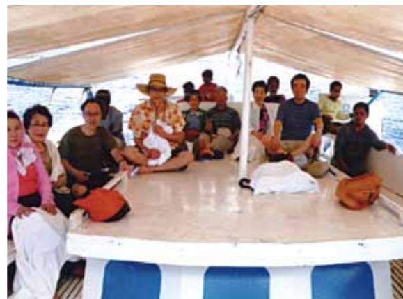
海水浴と海鮮・焼き肉バーベキューに向かう船の中で!心癒されるセブでの数日間はあつという間に過ぎてしまいました

数ヵ月前に、ふとした事でワールドビッグフォーを知りました。チラッと聞いて、その利用券買い取りに心を奪われ、内容や目的も良く聞かないまま、すぐ会員になってしまいました。身内からは騙されている。と心配されましたが、何故か不安もなく、むしろ楽しみと嬉しさで一杯でした。持っただけでも使い道のない少女のヘソクリは、もしかして泡と消える事があってもこんなにワクワクした気持ちをもたらすだけでもラッキーだと思っていました。また最近では海外に出掛けるのがおっくうになっており、セブにも絶対行く事はないだろうと思っておりました。ところが、内容が判ってくるにつれて、一度ぐらいいは現地を訪れてみたいという気持ちになってきました。そんな時偶然にも5泊6日でセブに行く人と出会い、同行させてもらうことになりましたので急いで切れていたパスポートを申請して一緒に行くことができました。良い旅仲間にも恵まれて、行きから帰りまで大笑いの毎日楽しさと、心癒されるセブでの数日間はあつという間に過ぎてしまいました。まず行って観光して理解する事ができました。オーナー会員になって、その利用券の買い取りで旅行出来る事。自分もリフレッシュ出来る事。なんて素晴らしい事でしょう。又、何度でも行きたくなりました。おいしいマンゴを食べに!お世話になったスタッフの皆さんにも逢いに!そしてわずか数ヵ月で私をこんなに幸せにしてくれた仲間と会社に感謝です。