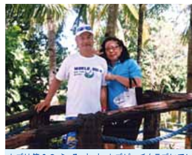
セブは第2のふるさと、セブビーチクラブにて!また寒くなったらリゾートライフを楽しみに飛んできます

“きょうも元気だビールがうまい!” 南国の海を眺めていると思わず口から出る言葉。朝から妻の嫌味もなく、いやむしろ妻もワイン片手に～カンパ～!もうこれだけでサンコー!!昼にもご馳走食べながらカンパ、夜にももちろんご馳走を食べながらカンパ、そう一番の楽しみはビールガンガン飲むこと。ここでの生活は、私にはちょっとはがゆいかもかもしれません。残念なことに、日本での生活スタイルが出てしまい“グッドハズバンド”なんて皆におだてられ、つい身