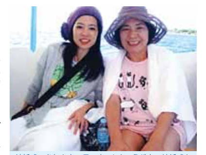
結婚式の参加も良い思い出でした! 我が家の結婚式をするために、再度訪れたいと思う良い旅行となりました

ワールドビッグフォーの会員になり、1年になります。パンフレットを眺めているだけでは会社の良さがわからないから、セブ島の施設を見学に行つて来てほしいと会社の方から言われました。そして、4泊5日の旅行に家族3人で参加しました。今回の旅は、施設見学と友人の娘さんの結婚式の参加を兼ねての旅行でした。日本では、水着も着る事ありませんが、セブ島では青い海に惹かれて、現地のデパートで水着を購入して海に入りました。日本では、体験できないマリンスポーツを楽しんできました。パラセーリング・バナナボートを娘と共に楽しい親子の時間を過ごせた事も良い思い出です。宿泊先のコーラルポイントリゾートもとても豪華で、全ての部屋に担当のメイドさんが付いていました。旅行中の身の周りの環境を整えてもらい、日本での生活では味わう事のできない、優雅な気分にもなれました。スタッフのみなさん、旅行中はありがとうございました。また、結婚式の参加も良い思い出でした。明るい様子で日本では体験できない結婚式の様子を見ることができました。娘もセブ島の結婚式を気に入った様でした。次回は、我が家の結婚式をするために、再度訪れたいと思う良い旅行となりました。