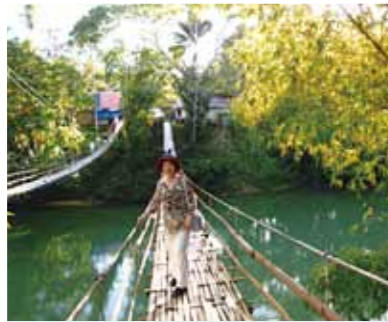
ボホール島にある竹床の揺れる吊り橋は気持ちいいです!わずか数ヵ月で私をこんなに幸せにしてくれた仲間と会社に感謝です