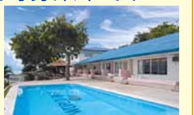
バディアンゴルフリゾート

URL http://www.jwbhotel.jp TEL 03(5817)0705