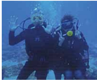
父と初めての2人旅! ダイビング体験では父も私も大苦戦しましたが、無事潜る事ができ、綺麗な魚に感動しました