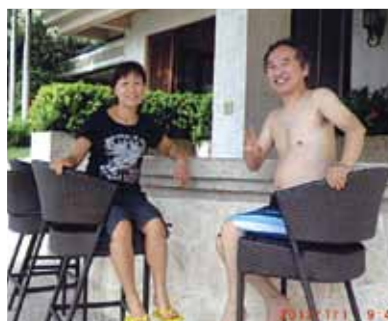
3度目のセブ旅行が実現する事を夢見る今日です!これも「ワールドビッグフォーの出会いがあったから」と心より感謝です