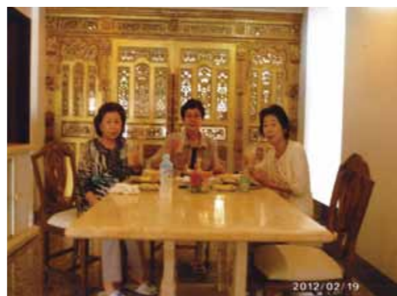
初めてのセブの旅、楽しい思い出を有難う御座いました! 見渡す限りエメラルドグリーン的大海はとても素敵でした

美しい南の楽園、お友達3人で4泊5日の旅に出発する。楽しみと少々不安な気持ちを抱きながらセブの旅を実行! セブ・マクタン国際空港に到着後、ガイドさんの笑顔で迎えられ一安心しました。夕食後、明日の予定などを話しながら別荘に向かった。ガイドさんは日本語がとても良く解かる人だったので大分助かり安心しました。当日は時間も遅くなってしまいお部屋でマッサージをしてもらう(予約済)大きなベッドでぐっすり休みました。2日目は市内観光する。デパートで買物・昼食・エステ等して体を休め気分は上々、話がつきない? 前日の疲れもすっかり取れた感じでした。3日目はパンダノン島に行く。見渡す限りエメラルドグリーン的大海はとても素敵でした。島ではおいしいバーベキュー、又海の浅瀬で写真等とる。帰りに本社のオフィスを見学させて頂きました。4日目は最終日なのでパラセーリングに挑戦しました。「最高に楽しかった!」シーウォーカーの体験は少々恐かったけれど「海の中でお魚と遊ぶなんて」夢の様な気がしました。当日6時頃からパーティー、生バンドの演奏で賑やかな雰囲気の中で美味しいご馳走を頂き、スタッフのダンス等で会場は盛り上がり最高に楽しかった。スタッフ始め最後の夜を過ごせた事にとても感謝致します。メイドさん、ガイドさん、ドライバーさん楽しい思い出を有難う御座いました。