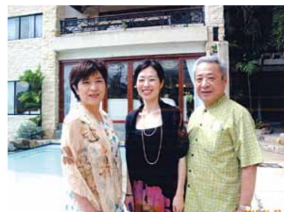
4泊5日の旅行に家族3人で参加しました! パラセーリング・バナナボートを娘と共に楽しい親子の時間を過ごせた事も良い思い出です

ワールドビッグフォーの会員になり、1年になります。パンフレットを眺めているだけでは会社の良さがわからないから、セブ島の施設を見学に行つて来てほしいと会社の方から言われました。そして、4泊5日の旅行に家族3人で参加しました。今回の旅は、施設見学と友人の娘さんの結婚式の参加を兼ねての旅行でした。日本では、水着も着る事ありませんが、セブ島では青い海に惹かれて、現地のデパートで水着を購入して海に入りました。日本では、体験できないマリンスポーツを楽しんできました。パラセーリング・バナナボートを娘と共に楽しい親子の時間を過ごせた事も良い思い出です。宿泊先のコーラルポイントリゾートもとても豪華で、全ての部屋に担当のメイドさんが付いていました。旅行中の身の周りの環境を整えてもらい、日本での生活では味わう事のできない、優雅な気分にもなれました。スタッフのみなさん、旅行中はありがとうございました。また、結婚式の参加も良い思い出でした。明るい様子で日本では体験できない結婚式の様子を見ることができました。娘もセブ島の結婚式を気に入った様でした。次回は、我が家の結婚式をするために、再度訪れたいと思う良い旅行となりました。