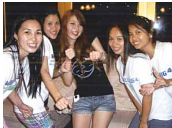
充実のセブ!! 次回はもっと長く滞在できたらいいなと思います! とても幸せな、思い出に残る旅になりました

今回は、父と初めての2人旅でした。セブに到着し、ガイドさんと運転手さんと食事に行くと、見覚えのある顔が! 8年前に家族で訪れた時に顔を合わせた現地スタッフさんでした。私達の事を覚えていて、声を掛けてくれました。コーラルポイントリゾートに着き、相変わらずの部屋のゴージャスさに感動です。海を見ながらベランダのイスに座ってボーッとしている時間は最高の贅沢です。2日目はダイビングに挑戦、プールでの練習の時点で父も私も大苦戦しましたが、無事潜る事ができ、綺麗な魚に感動しました。夜のパーティーでは、同年代のメイドさんが多く、片言の英語でコミュニケーションをとるのがまた楽しかったです。3日目は地元のお祭りを観賞した後買物、そしてスパへ行きました。全身マッサージやパックなどをしたのですが、とても気持ちよく、肌もつるつるになり、値段もリーズナブルで大満足でした。4日目は一日中買物をして、夜はあるホテルのレストランで食事をしました。とてもおしゃれで、料理も美味しく、心もお腹も満たされました。今回は父との2人旅でしたが、ガイドさん、メイドさん達がいてくれたからこそ、ステキな旅にすることができました。今回は4泊5日でしたが、次回はもっと長く滞在できたらいいなと思います。とても幸せな、思い出に残る旅になりました。父、母、関わって下さった全ての方に感謝です。ありがとうございました。