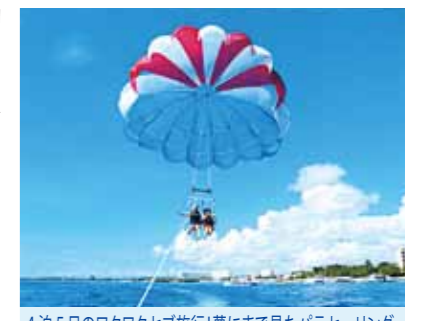
4泊5日のワクワクセブ旅行! 夢にまで見たパラセーリング・シーウォーカーと、思う存分セブを満喫することができました

少しの不安と、大きな期待を胸にセブ・マクタン空港へ到着。外に出ると、名前のプラカードを掲げ笑顔で待っていてくれたガイドさん。不安は、いつの間にか楽しみのワクワク感に変わっていました。夕食後、宿泊先のコーラルポイントリゾート地に向かう途中、道路一杯の人の波、太鼓や野外ディスコの激しい音楽、そして花火も打ち上げられ、お祭りの真っ最中、車は前に進む事ができず横道へ。翌日はパレードも見ることができ、とてもラッキーな時に訪れる事ができました。4泊5日の日程でしたが、目の前は見渡す限りのエメラルドグリーン的大海、そして島巡りにバーベキュー、夜景。翌日はボホール島へターシャに会いに、あまりの可愛さにはしゃいでしまいました。最後は夢にまで見たパラセーリング・シーウォーカーと、思う存分セブを満喫することができました。これも朝早くから夜遅くまで笑顔で接してくれたガイドさん始めスタッフの皆様のお陰で叶う事ができ感謝しています。本当にありがとうございました。