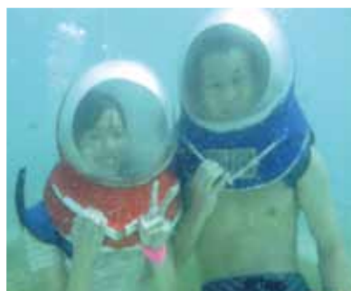
念願だったシーウォーカー、魚たちと触れ合え感動! 他にもパラセーリングなど初めての経験ばかりで全てが新鮮でした