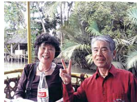
ボホール島ではターシャの可愛さにはしゃいでしまいました! 満喫できたセブ、本当にありがとうございました

少しの不安と、大きな期待を胸にセブ・マクタン空港へ到着。外に出ると、名前のプラカードを掲げ笑顔で待っていてくれたガイドさん。不安は、いつの間にか楽しみのワクワク感に変わっていました。夕食後、宿泊先のコーラルポイントリゾート地に向かう途中、道路一杯の人の波、太鼓や野外ディスコの激しい音楽、そして花火も打ち上げられ、お祭りの真っ最中、車は前に進む事ができず横道へ。翌日はパレードも見ることができ、とてもラッキーな時に訪れる事ができました。4泊5日の日程でしたが、目の前は見渡す限りのエメラルドグリーン的大海、そして島巡りにバーベキュー、夜景。翌日はボホール島へターシャに会いに、あまりの可愛さにはしゃいでしまいました。最後は夢にまで見たパラセーリング・シーウォーカーと、思う存分セブを満喫することができました。これも朝早くから夜遅くまで笑顔で接してくれたガイドさん始めスタッフの皆様のお陰で叶う事ができ感謝しています。本当にありがとうございました。