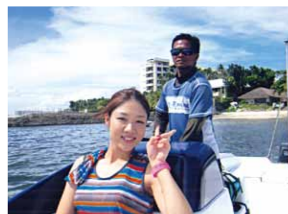
とても魅力のある大満喫したセブ島旅行! 感動の海でマリンスポーツを満喫、水上スキーにパラセーリング等を楽しみました

母に勧められ今回セブ島へ旅行に行ってきました。日本から約4時間程でセブ島へ到着。その日はフィリピンレストランで夕食を済ませ、滞在先へ向かいました。滞在先はコーラルポイントリゾート、私が今まで泊まったことのないとても豪華なところでした。そして翌朝窓から一面の海、とても感動しました。旅行中はまずマリンスポーツ、水上スキーにパラセーリングを楽しみました。翌日は島巡りでボホール島へ行きました。ボホール島では教会へ行き、そのあとは動物園で島の珍しい動物を見学してきました。そして、船で音楽を聞きながらの昼食。そのあとはとても楽しみにしていたジップラインに乗りました。ボホール島では自然豊かな景色に動物にも触れ合うことができ、日常の生活を忘れてしまうほど満喫し癒されました。最終日は一日中買物をしました。リーズナブルなものが沢山あり大満足。あっという間に旅行が終了してしまいました。滞在中はガイドさん、ドライバーさん、メイドさんが毎日お世話をしてくれ、旅行前に感じていた不安は全くなし本当に楽しめることが出来ました。セブ島は繁華街から少し離れたところはまだまだ乏しさを感じる場所がありましたが、とても魅力のあるセブ島にまた来たいと思いました。色んなことを感じる貴重な旅行となりました。