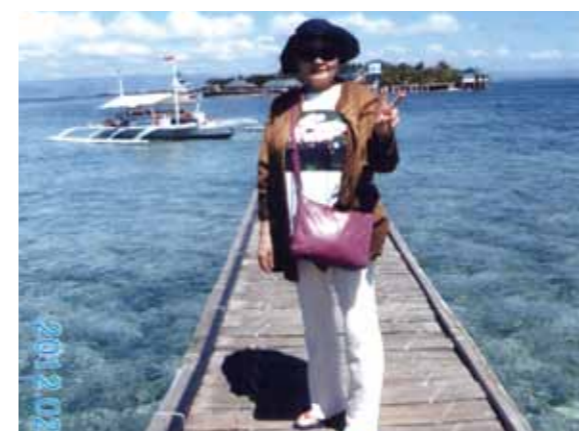
初めてのセブ、来年はもっと長く滞在するつもりです! スタッフの方達の親切な気持ちに感謝、有難うございました

この度4泊5日というスケジュールで初めてセブ島へ行かせて頂きました。成田空港を定時に出発、予定通りにセブ・マクタン空港へ到着。すぐにガイドさんとドライバーさんに会い、夕食に現地料理を満喫しコーラルポイントリゾートへ。メイドさんが作ってくれたウェルカムドリンクの濃厚マンゴジュースに感動しました。2日目はナルスアン島へ行きシュノーケリングで海中のきれいな魚に餌をやって触れ合いました。3日目はボホール島へ行き、チョコレートヒルや可愛いターシャにもご対面でき、夜はガイドさんに紹介されたエステへ行き、毛穴の奥までスッキリしてツルツルお肌になり大満足!! 4日目はさすがに疲れも出るだろうと、近くのラブラブ像を見学に行き、巨大スーパーマーケットへ買い物に行き、現地の魚や野菜や納豆を購入、コーラルポイントリゾートで日本料理をお世話になったガイドさんやドライバーさん、メイドさんに堪能して頂きました。初めての海外旅行で不安は沢山あったのですが、スタッフの方達の親切な気持ちで到着してすぐにそんな不安はどっかへいってしまいました。毎日お姫様の様な待遇で自分の部屋に帰るのが嫌になってしまう位でした。来年はもっと長く滞在するつもりです。この度は大変お世話になりました。有難うございました。