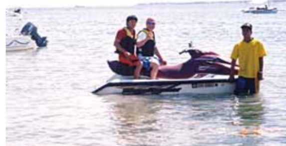
念願のジェットスキー体験、インストラクターが運転してくれるのが恐かった!次回のセブ旅行ではどんな出会いがあるか今からワクワクします

“きょうも元気だビールがうまい!” 南国の海を眺めていると思わず口から出る言葉。朝から妻の嫌味もなく、いやむしろ妻もワイン片手に～カンパ～!もうこれだけでサンコー!!昼にもご馳走食べながらカンパ、夜にももちろんご馳走を食べながらカンパ、そう一番の楽しみはビールガンガン飲むこと。ここでの生活は、私にはちょっとはがゆいかもかもしれません。残念なことに、日本での生活スタイルが出てしまい“グッドハズバンド”なんて皆におだてられ、つい身