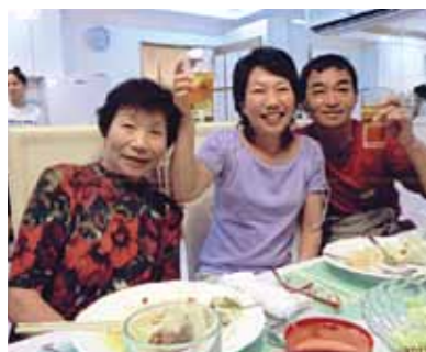
やり残したマリンスポーツをするために、もう一回セブ島に行きます! さよならパーティーは大盛り上がり、笑いでろけて涙が出ました