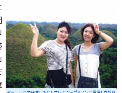
ボホール島では楽しみにしていたジップラインに挑戦! 自然豊かな景色に動物にも触れ合うことができ、大いに癒されました

母に勧められ今回セブ島へ旅行に行ってきました。日本から約4時間程でセブ島へ到着。その日はフィリピンレストランで夕食を済ませ、滞在先へ向かいました。滞在先はコーラルポイントリゾート、私が今まで泊まったことのないとても豪華なところでした。そして翌朝窓から一面の海、とても感動しました。旅行中はまずマリンスポーツ、水上スキーにパラセーリングを楽しみました。翌日は島巡りでボホール島へ行きました。ボホール島では教会へ行き、そのあとは動物園で島の珍しい動物を見学してきました。そして、船で音楽を聞きながらの昼食。そのあとはとても楽しみにしていたジップラインに乗りました。ボホール島では自然豊かな景色に動物にも触れ合うことができ、日常の生活を忘れてしまうほど満喫し癒されました。最終日は一日中買物をしました。リーズナブルなものが沢山あり大満足。あっという間に旅行が終了してしまいました。滞在中はガイドさん、ドライバーさん、メイドさんが毎日お世話をしてくれ、旅行前に感じていた不安は全くなし本当に楽しめることが出来ました。セブ島は繁華街から少し離れたところはまだまだ乏しさを感じる場所がありましたが、とても魅力のあるセブ島にまた来たいと思いました。色んなことを感じる貴重な旅行となりました。