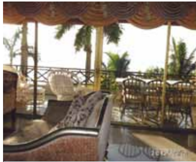
楽しい時を過ごすことができました!初めての海外旅行も、現地ではドライバー・ガイドが常に同行してくれていたので安心でした