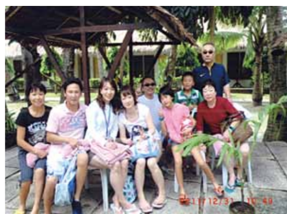
思い出に残るセブ島は本当に素晴らしかった!温暖な気候に美味しい食事、遠浅の海の素晴らしさには本当に感動した

今回で2回目となるセブ旅行は、年末年始にかけ5泊6日の予定で「前回観る事のできなかった所へ行きたい」と思いをつのらせての出発であった。1月のセブ島は冬期という事を調べてわかった。しかし、日本のような寒さではなく、日本でいう夏に近い暖かさであり、すがすがしく感じられる毎日であった。食事もフィリピン料理、マンゴジュース、ハロハロと土地の食生活にとけ込む事ができた。特に「パンシット(中華風焼きそば)」「シシグ(ガーリックオニオンの炒め物)」等、我家の食卓に取り入れて欲しいと思う一品であった。遠浅の海の素晴らしさには本当に感動した。浅瀬でも熱帯魚が目で確認される程の透明さには一日中時間を忘れ、子供の頃に戻った気がした。日本ではめったに見る事の出来ない光景だ。これも「ワールドビッグフォーの出会いがあったから」と心より感謝、会員の皆様にも感謝、3度目のセブ旅行が実現する事を夢見る今日です。スタッフの皆さんには、朝早くから遅くまで笑顔で私達の面倒をみていただき、思い出に残るセブ島は本当に素晴らしかった。有難う御座いました。又、今回のスタッフに出逢える事を楽しみにしております。