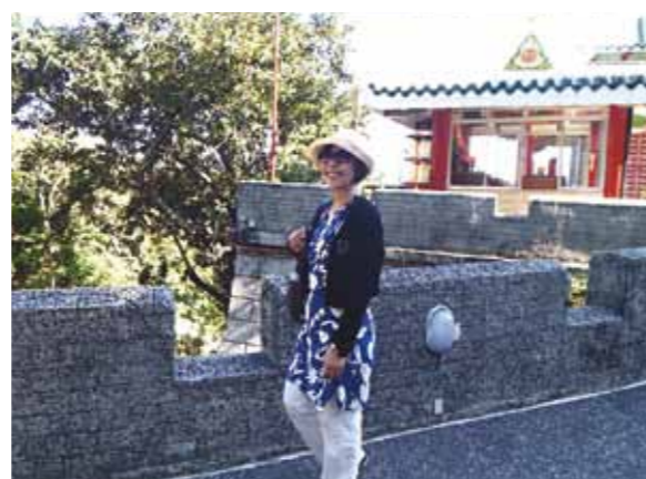
「幼きイエス像サント・ニーニョを崇めるセブ版リオのカーニバル」! ダンスと音がどこまでも続くかと思えるほどのパレードにウォー!!

「毎年行こうね。」と、弟夫婦と約束したセブ島旅行も3回目になりました。今回は語学学校に留学するためと1年に1回のセブ島最大の祭り「シヌログ」を見るために行きました。パンフレットに「幼きイエス像サント・ニーニョを崇めるセブ版リオのカーニバル」とある様に、当日は、どこからこんなに人が来るのかと思えるほどの人出と相変わらずの日差しで圧倒されました。ダンスと音がどこまでも続くかと思えるほどのパレードに3時間も沿道に立って見学していたら堪能すぎて疲れてしまいました。屋台もそここにあり、たくさんの人々が買って食べて楽しんでいる様子は日本のそれと同じようでした。本来の旅行の目的であるゆったりとした時が流れるセブ島は、カモテス島への船旅と滞在で満喫しました。関係者以外全く人のいないカモテス島の静けさと海の美しさに、これぞセブと感動しました。前に見える島はレイテ島だと聞き、ここで戦争があり、双方に多大の死者が出たことを思い、合掌。今は静かな海です。その後、弟夫婦と別れて私だけセブ市内の語学学校に1週間の短期留学をしてきました。英語の習得は十分ではありませんでしたが、よい経験になりました。自分一人でもかかすので、ワールドビッグフォーの贅沢な接待と食事の良さに今更ながら気付きました。セブでガイドさんと運転手さん付きの車を使えるということや、メイドさんたちに何もかもお世話をしていただけるということも信じられない程の贅沢なことなのだとわかりました。来年もまた豊かな時間を求めてセブに行きたいと思っています。