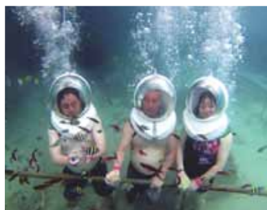
誰が雨男？雨女？ヘルメットしたら聞こえな〜い！ちなみに私は晴れ女です！