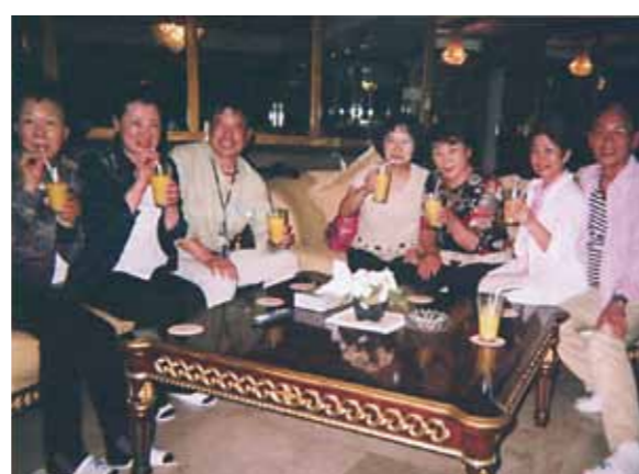
4回目のセブ!今回の旅行も良い仲間にも恵まれ、フィリピン料理、中華、韓国料理等を堪能!とても楽しく過ごす事ができました

今回で4回目のセブ旅行になります。1月22日、7人のグループで出発しました。初めてお会いした方もいましたが、気軽にお話でき和気あいあいと楽しい旅になりました。セブ島では25日から何日間かキリスト教の集まりがあり、入れないところもあるので、2日目はセブ島での観光とショッピングを楽しみました。3日目はパンダノン島でのバーベキュー、お肉もお魚もとてもおいしく、海はブルーとグリーンに広がり、思わず皆で歓声を上げました。夜は日本からグループの方が持って来て下さったそうめんとはん、そしてメイドさん達が作ってくれたフィリピン料理で楽しい夕食、ビンゴゲームで大いに盛り上がりました。4日目はボホール島への船旅、待合室でのマッサージで頭も身体も軽くなりました。5日目は雨になりましたがマッサージ、かかとの角質とりとネイルでゆったりした時間を過ごしました。今回の旅行も良い仲間にも恵まれ、フィリピン料理、中華、韓国料理とどれもおいしくとても楽しく過ごす事ができました。今回お世話になったワールドビッグフォーの社員の皆様、本当にありがとうございました。