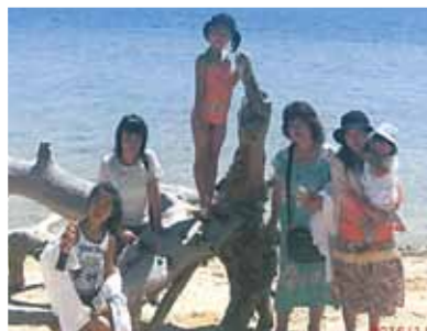
娘と孫3人、女だけの旅です!冬から夏へ、寒いねから暑いねへ。メイドさん達にも可愛がって貰い孫達も満足そうでした!