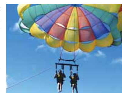
とりあえずパラセーリングで飛んでみました。最初の不安は綺麗な海を見下ろすと私たちと一緒に飛んでいきました

今回は初めてのセブ。去年10月に決まってからワクワクして当日を迎えました。夜8時頃着き、夕食は日本料理店でマンゴー寿司を頂き、リゾートに向かいました。暑いせいか大勢の若者、子供達が道路脇で食べたり話をしていて、夜なのに賑やかなこと!!翌日からは真青な空、海から昇る太陽を拝み、マンゴージュース、バナナやパイナップル、パン等で朝食。果物は甘味があって日本で食べるより美味しい。その後、パラセーリングとシーウォーカーを初めて体験。説明を聞いた後は安心して南国の空と海を思い切り羽を伸ばし楽しみました。夜はニューハーフショーに行き、舞台と観客が一体となったショーで、あつという間の1時間でした。3日目はパンダノン島での海水浴で身体が自然にプカプカ浮き、気持ち良く泳げビックリ。その後のビールとバーベキューは最高!!夕方の足裏マッサージは今までのかさかさした角質が取れ、すべすべした足裏になり良かったです。4日目はシヌログという年1回1月に行われるセブ島最大の祭りのパレードを見に行きました。熱気ムンムン島々から集まった若者、子供達の他に映画スターも加わり、皆々のフィーバーに圧倒されました。現地のお面を買って、早々に退散。運良く見れて感激!!夜はマルコポーロホテルでお別れバイキング。ワインと好きな料理で乾杯。あつという間の旅でした。改めてワールドビッグフォーの皆様、現地のスタッフの皆さんに感謝します。P.S.、日本に帰ったら雪が積もっており、車は遠回り、最後は月を眺めながら坂道を上りやっと我が家に着きました。