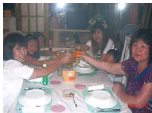
全てを6泊中にやりたい!とのことで、楽しかったり、怖かったり、痛かったり、冷たかったり、たくさんの事を体験!(笑)

またまたセブです!6回目、今回は念願の旅行で～す♪娘と孫3人、女だけの旅です。いつもセブの話ばかりで、一度も行った事のない娘、孫も大喜びでした。できること全てを6泊中にやりたい!とのことで、スケジュールをしっかり立てて出かけました。短い滞在期間でスケジュール通りに動く事が出来てやりたい事全てをこなしました。楽しかったり、怖かったり、痛かったり、冷たかったり、たくさんの事を経験したようです。冬から夏へ、寒いねから暑いねへ。メイドさん達にも可愛がって貰い孫達も満足そうでした。最終日前夜のパーティーもはしゃいでダンスをしたり、とても思い出になった旅だったと思います。又近い将来、セブの思い出を作る為に行きたいと思っています。ガイドのリサさん、ドライバーさん、孫達をよく見ていただいて、楽しい日々をありがとうございました。ワールドビッグフォー様に感謝し、またセブに行きたいと思っています。