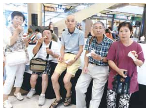
ショッピングで市内に出ると新しいビル建設が本当に盛ん!グッと綺麗な車が多くフィリピンの発展は目を見張るようです!