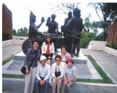
お花の先生、お誕生日おめでとうございます! 後ろの方達も乾杯!!