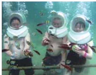
雨で寒くて震えるましたが、海の中は思いのほか温かったです♪