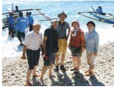
久しぶりのセブ行き!カオハガン島のバーベキュー、ジンベエザメ、ショッピングを満喫。前回よりも更に感動をして帰って来ました!

久しぶりのセブ行き!朝9時30分に家を出てセントレア(中部国際空港)へ。以前は朝6時には家を出て成田空港へ行ったが、セントレア出発で3時間の余裕が出来たのは本当にありがたい事です。何となくセブが近くなった様な気がして行く回数が増えるかも…。今回は6泊と今までより2泊も多いのに人数は5人と少人数!初めての人を中心に行動をしようと言うことで、到着した夜は皆でこれからの予定を打ち合わせ。2日目はカオハガン島へ、パッチワークで有名な島です。ゆっくりと島内を見て子供達と触れ合い、バーベキューで腹ごしらえ、島を一回りしコーラルポイントリゾートに帰り夕食、またセブ市内へ出ました。翌日はバディアンゴルフリゾートでゴルフを楽しむ!私は今回、医者に止められていたのでギャラリーに回り、冷やかしながら半日楽しく過ごしました。翌日は朝6時にジンベエザメを見るという事で海岸端をぐるっと回り朝8時頃到着。もうすごい人で一杯、色々説明を聞き私たちのグループが船に乗り込みジンベエザメの居るところへ、ジンベエザメは手に届く所まで寄ってきたり、大きな口を開け餌を飲み込む様は何とも荘厳、船頭さんが私のカメラで撮ってくれると言ってカメラを持って潜って行き、20分、30分と時間が経っても上がって来ず、皆で「カメラを持って行ってしまったのかな?」なんて心配をしていたのですが、その後ちゃんと上がって来ました。ジンベエザメも珍しかったのですが、船頭さんの1度に潜ったら30分以上も上がって来ない事に驚き、前回よりも更に感動をして帰って来ました。5日目は久しぶりにボホール島へ、この島も今新飛行場の工事が始まっている様です。最終日前日は少しショッピングをしようと市内に出ました。道路工事はあちらもこちらも、新しいビル建設が本当に盛んで、グッと綺麗な車が多くなっていてフィリピンの発展は目を見張るようです。この次又行くのが楽しみです。