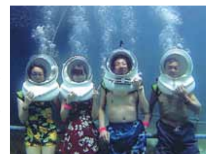
水中では思うように身体は動かない、距離感もよくわからない(汗)前を歩いている妻達の動きが面白くて、海の中でひとり大笑い！