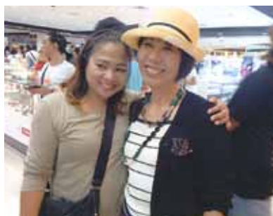
「毎年行こうね。」と、弟夫婦と約束したセブ島旅行も3回目! 今回、市内の語学学校に1週間の短期留学も出来、よい経験に!!