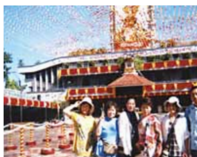
7人のグループ和気あいあいと楽しい旅!観光、ショッピング、マッサージなどでゆったりした時間を過ごしました!