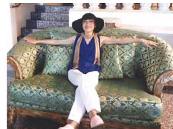
主人の姉との3人旅!カモテスリゾートではリニューアルした施設に感動し、今回はここに!と主人と約束♪

今回のセブ旅行は、ほんとに楽しみにしていました。実は昨年の3月セブ島旅行中に主人が病気になるにセブ市内の大学病院に行き診察で大変でした。まだ完治ではありませんが、自然豊かなセブ島の空気がきっと主人の病気を治してくれると信じてセブ旅行を計画しました。今回も前回同様、主人の姉との3人旅です。マクタン・セブ空港でガイドのシャローンさんの出迎えを受け、私が楽しみにしていたフィリピン料理のお店に無事到着、ビールで乾杯です!主人は歴史が好きで、セブ市内の教会やマジェラン・クロス、最後の晚餐礼拝堂等に興味深く見学していました。私は、展望台からの夜景に感激しました。上に星空、下には宝石を散りばめたような町並み、セブの魅力との新しい出会いです。しかも前回行けなかったカモテスリゾートに行きました。リニューアルした施設がとても素晴らしかったので、今回はここに泊まりましようとして主人と約束しました。最後にメイドさん、ガイドさん、ドライバーさん、ありがとうございました。