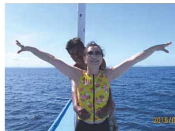
南国の空と海、思い切り羽を伸ばし 楽しみました。船の上で飛ぶ練習

今回は初めてのセブ。去年10月に決まってからワクワクして当日を迎えました。夜8時頃着き、夕食は日本料理店でマンゴー寿司を頂き、リゾートに向かいました。暑いせいか大勢の若者、子供達が道路脇で食べたり話をしていて、夜なのに賑やかなこと!!翌日からは真青な空、海から昇る太陽を拝み、マンゴージュース、バナナやパイナップル、パン等で朝食。果物は甘味があって日本で食べるより美味しい。その後、パラセーリングとシーウォーカーを初めて体験。説明を聞いた後は安心して南国の空と海を思い切り羽を伸ばし楽しみました。夜はニューハーフショーに行き、舞台と観客が一体となったショーで、あつという間の1時間でした。3日目はパンダノン島での海水浴で身体が自然にプカプカ浮き、気持ち良く泳げビックリ。その後のビールとバーベキューは最高!!夕方の足裏マッサージは今までのかさかさした角質が取れ、すべすべした足裏になり良かったです。4日目はシヌログという年1回1月に行われるセブ島最大の祭りのパレードを見に行きました。熱気ムンムン島々から集まった若者、子供達の他に映画スターも加わり、皆々のフィーバーに圧倒されました。現地のお面を買って、早々に退散。運良く見れて感激!!夜はマルコポーロホテルでお別れバイキング。ワインと好きな料理で乾杯。あつという間の旅でした。改めてワールドビッグフォーの皆様、現地のスタッフの皆さんに感謝します。P.S.、日本に帰ったら雪が積もっており、車は遠回り、最後は月を眺めながら坂道を上りやっと我が家に着きました。