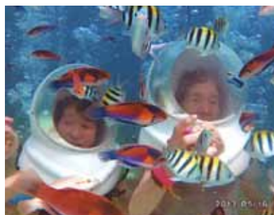
前回出来なかったシーウォークに挑戦! 竜宮城にでも居るかの様な錯覚をしようでした!