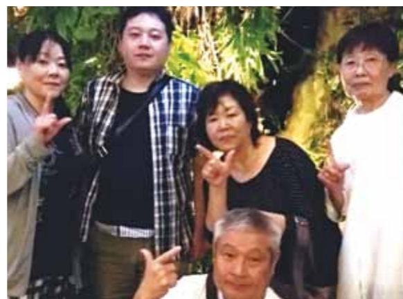
初めてのセブ島、家族3人と仲間2人、計5人の旅行。関係者の皆様、ありがとうございました！

今回初めてのセブ島、家族3人と仲間2人、計5人の旅行になります。今、日本では真冬で寒い日々ですがセブ島は真夏のイメージを持って楽しみにしていました。14時25分成田発、予定通りの出発、19時30分セブマクタン空港に無事到着しました。気温は少し高め28℃くらいでした。今回のガイドさんが笑顔で出迎えに来てとても良い感じでした。明日を楽しみにして夕飯に行くことになりました。食後、今回泊まるコーラルポイントリゾートへ向かい、軽くガイドさんと明日の予定を決めました。気になる天気は？明日の楽しみにして眠りました。2日目の朝は雨になり、予定していたマリンスポーツの一つパラセーリングを中止にし、シーウォーカーにしました。とても寒くて震えましたが、海の中は思いのほか温かったです。その後5人でショッピングに行きましたが車の渋滞がすごかったです。ドライバー(フランス)の運転がとてもうまくビックリしました。3日目も雨。ボホール島でのランチクルーズ、チョコレートヒルズの予定も雨と風が強く道路状況も悪くなり短縮。残念でした。4日目はようやく晴天になり、ワールドビッグフォー主催のバーベキュー。船に乗り約1時間で行く小島、パンダノン島です。3色の海はとても美しく、到着後はすぐに海に入りました。その後はメイドさんたちがとても美味しく肉や野菜を料理してくれて感激しました。「ありがとう。」帰りの海風もとても気持ちよかったです。今日の夕飯はマルコポーロホテルです。品数が多くて高級食材、食べ過ぎたあ。あつという間の4泊5日の旅、明日は日本に帰るだけです。今回は少し雨にやられたかなあ。関係者の皆様、ありがとうございました。ドライバー(フランス)最高でした。メイドさん達、本当にありがとうございました。良い思い出になりました。