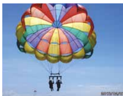
あっという間の7日間でした。ありがとうございました~!! 私達はこれで帰りませす。