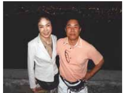
展望台からの夜景に感激!上に星空、下には宝石を散りばめたような町並み、セブの魅力との新しい出会いです!

今回のセブ旅行は、ほんとに楽しみにしていました。実は昨年の3月セブ島旅行中に主人が病気になるにセブ市内の大学病院に行き診察で大変でした。まだ完治ではありませんが、自然豊かなセブ島の空気がきっと主人の病気を治してくれると信じてセブ旅行を計画しました。今回も前回同様、主人の姉との3人旅です。マクタン・セブ空港でガイドのシャローンさんの出迎えを受け、私が楽しみにしていたフィリピン料理のお店に無事到着、ビールで乾杯です!主人は歴史が好きで、セブ市内の教会やマジェラン・クロス、最後の晚餐礼拝堂等に興味深く見学していました。私は、展望台からの夜景に感激しました。上に星空、下には宝石を散りばめたような町並み、セブの魅力との新しい出会いです。しかも前回行けなかったカモテスリゾートに行きました。リニューアルした施設がとても素晴らしかったので、今回はここに泊まりましようとして主人と約束しました。最後にメイドさん、ガイドさん、ドライバーさん、ありがとうございました。