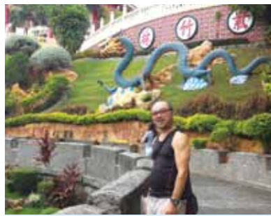
あれから30年、リゾートとして発展してきたセブへ!平和で活気に満ちたセブ体験、本当に楽しめました。また行きたいなと思います