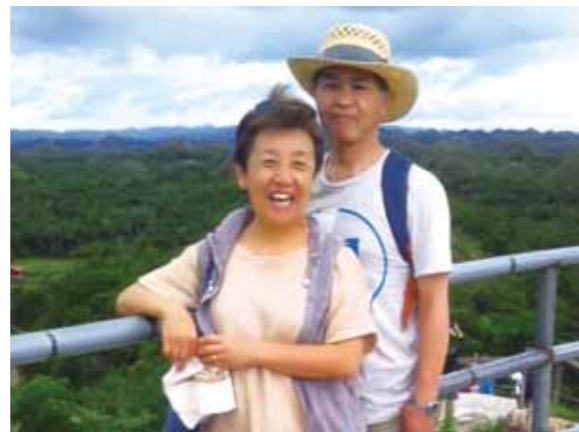
今回で3回目、夫婦では2回目のセブ旅行です! 非日常を味わいゆっくり流れる時間を楽しみました

3回目のコーラルポイントリゾート、1回目はWORLD BIG 4に誘って下さった友人と、その仲間達と行きました。初めてのセブ旅行はゴージャスなコーラルポイントリゾートにびっくりポン。メイド、ドライバー、通訳と涼しい車両と至れり尽せりでした。もう一つのびっくりポンは現地の人々の生活でした。今回は2度目の夫婦セブ旅行でした。目的は忙しすぎる東京での生活から離れ、ゆっくり流れる時を味わう事。読みたい本を持ち込み、心行くまで読書をし、優雅なマダム気分を味わってきました。前はパディアンゴルフリゾートでPlayをして1泊したので、今回はカモテスリゾートに1泊しました。東京では車の音の中で生活をしています。窓を開けると車両のエンジン音の波です。セブでの何よりのご馳走は静けさです。そして空気がきれいなのでしょう、埃が無いことに気づきました。セブ島の渋滞にもビックリしました。経済発展と引き換えに失う物が多いのも現実です。「大事な物を失わないように発展してほしいな!」と車窓を眺めていました。今夏は夫の仕事の都合で6月になりました。セブ島の雨期になってしまい抜ける様な空をなかなか見る事ができませんでした。次回は乾期に行って、ああして、こうしてと既にセブでの生活に思いを巡らせております。