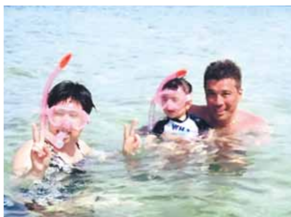
息子と浜辺や海で遊び、船に乗って離島でバーベキューと海水浴も楽しめました!

両親が何度かセブ島へ行っていたのは知っていましたが、私は今回が初めてで、二歳にならない息子と妻と両親、父の古くからの友人6名でのセブでした。セントレア(中部空港)からテンションの高い息子。私もそんな息子を見て「どんな旅になるのだろう?」とワクワクしていました。セブ島に到着した頃にはもう既に日が落ちていましたが、セブの街のスーパーで色々な商品が買え、楽しかったです。コーラルポイントリゾートに着き、二階建ての素敵な部屋(スペシャルビラ)へ案内され、息子も私も妻もテンションが高くなりました。次の日は早速息子とプールへ! プールが大好きな息子は大はしゃぎ! 大きいプールに大満足! 三日目は船に乗って離島でバーベキューと海水浴。海の中の魚を見たり、息子と浜辺や海で遊び、帰りの船では息子が皆を楽しませてくれました。四日目、パラセーリングとシーウォーカーを楽しみました。空から見たセブの海、街は、とても素晴らしかったです。あつという間の六日間でしたが、今度は大きくなった息子と二人でパラセーリングを楽しみたいです。