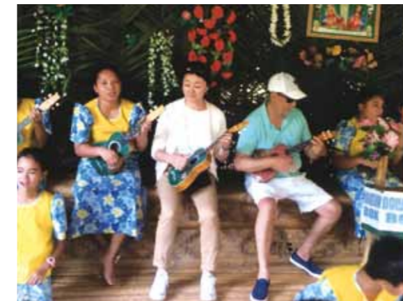
普通の人もセブ体験できるセブ島♪本当に今回は色々な意味で、最も思い出深い旅となりました

6月に6泊7日の日程で、セブ・コーラルポイントリゾートへ行く事が出来ました。実は、昨年10月に会員となった母と12月にセブ島行きを予定していたのですが、出発の4日前に母が急逝し中止。その時はワールドビッグフォーの皆様の素早い対応には大変感謝しております。私は商社勤務でもあり、今まで世界中を旅してきましたが、本当に今回は色々な意味で、最も思い出深い旅となりました。谷津田さんから素敵な話はたくさん聞いて