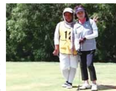
やはりセブ島は楽園ですネ! ゆっくりとゴルフを楽しんで来ました!

やはりセブ島は楽園ですネ! 2回目の旅行では、前回他のメンバーさんと一緒にマリンスポーツはせずに、ゴルフリゾートやショッピングを大いに楽しみ、リフレッシュして来ました。休暇のとり易い夏休み、台風後の日本を去り、帰省時はまた別の台風接近と心配されました。今回は二人だけとあって心配ごともありましたが、通訳さん、運転手さん、またメイドさん達にはコーラルポイントリゾートでの夕食のお世話もお願いしました。とっても美味しかったです。現地ではゴルフを先ず9ホール。キャディーさんにチップの割り増しも請求されましたが、「規定どおりですよ」とお断りもできました。平坦なコースはまずまず。疲れもあったので、夜はマッサージを依頼しました。前回と同じ低料金の満足マッサージは皆さんに是非ともおすすめ。翌日はバディアンゴルフリゾートへ。青い海に面した宿泊施設前にはプール。ファミリーにとっては素晴らしいと感動しました。もちろん翌日の18ホールの広大な難コースでは、キャディーさんの女性二人と楽しくラウンドができました。スコアも付けていただき、OBボールは近くで遊んでいた子供達へのプレゼントになりました。そしてリピートのマッサージも心地良く、快調な日々を過ごして帰宅できました。通訳さん&運転手さんと一緒に連日のランチ・夕食もまた楽しい思い出となりました。