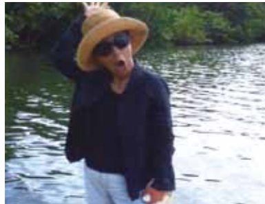
セブの何よりのご馳走は静けさと空気のきれいなこと、思いっきり空気吸っておきます