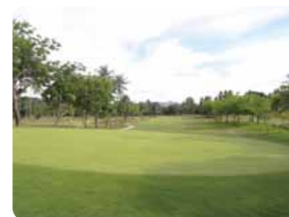
18ホールシーサイドゴルフコース