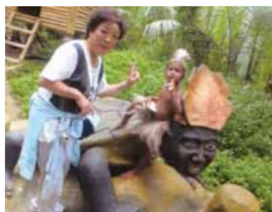
メガネ猿のターシャはあまりの小ささに目を血にして見入る!この子は違います!(笑)