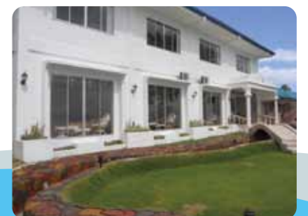
快適な滞在を約束するホテル新館