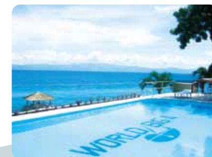
遮るものが何もない大パノラマ