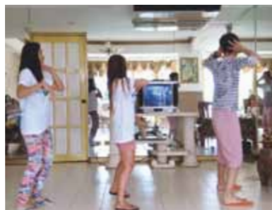
メイドさん達には、ズンバ、歌、英語にセブ語まで習いました!