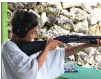
射撃体験やマリンスポーツも満喫! パラセーリングでセブ島の海へ! 今まで見たことの無い光景に感動