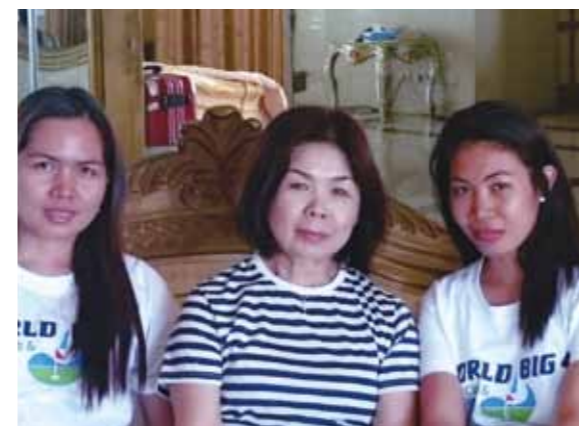
セブでは快調な日々を過ごして帰宅できました! お世話になり本当にありがとうございました!

やはりセブ島は楽園ですネ! 2回目の旅行では、前回他のメンバーさんと一緒にマリンスポーツはせずに、ゴルフリゾートやショッピングを大いに楽しみ、リフレッシュして来ました。休暇のとり易い夏休み、台風後の日本を去り、帰省時はまた別の台風接近と心配されました。今回は二人だけとあって心配ごともありましたが、通訳さん、運転手さん、またメイドさん達にはコーラルポイントリゾートでの夕食のお世話もお願いしました。とっても美味しかったです。現地ではゴルフを先ず9ホール。キャディーさんにチップの割り増しも請求されましたが、「規定どおりですよ」とお断りもできました。平坦なコースはまずまず。疲れもあったので、夜はマッサージを依頼しました。前回と同じ低料金の満足マッサージは皆さんに是非ともおすすめ。翌日はバディアンゴルフリゾートへ。青い海に面した宿泊施設前にはプール。ファミリーにとっては素晴らしいと感動しました。もちろん翌日の18ホールの広大な難コースでは、キャディーさんの女性二人と楽しくラウンドができました。スコアも付けていただき、OBボールは近くで遊んでいた子供達へのプレゼントになりました。そしてリピートのマッサージも心地良く、快調な日々を過ごして帰宅できました。通訳さん&運転手さんと一緒に連日のランチ・夕食もまた楽しい思い出となりました。