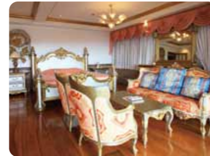
A棟4階56畳のベッドルーム

ホテル等とは異なるメイド付き別荘の滞在中、ご家族やご友人との寛ぎの時間をお楽しみ下さい。