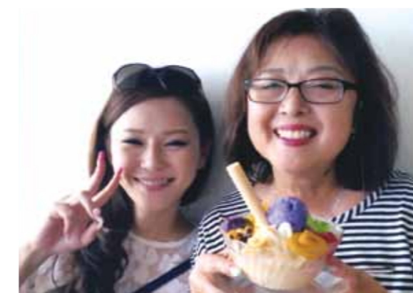
今年は娘と二人旅!!二人だけなのに広いお部屋に泊まりセブ気分でした

昨年は一人旅という事で周りから心配され、私自身不安でいっぱいでしたが、何の心配もなく楽しく過ごす事が出来ました。今年は娘と二人旅!!コーラルポイントリゾートでは、二人だけなのに広いお部屋に泊まりセブ気分でした。その部屋から見える青い海に感動しました。船でパンダノン島に渡り、シュノーケリングを楽しみ、BBQをダイナミックに手で味わいました。ボホール島ではメガネ猿のターシャに会う事も出来、あまりの小ささに