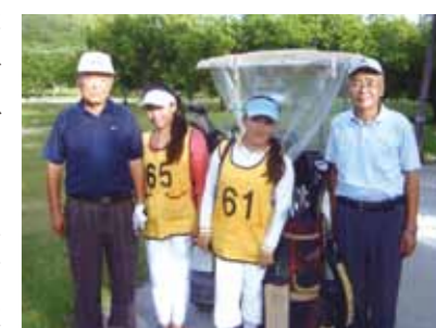
バディアンゴルフリゾートでは、初めてゴルフクラブを握る3名と6名でゴルフを楽しみました!

近所の新会員6名と妻の8名で、私が引率するような感じで久しぶりのセブ旅行を楽しんできました。8月のセブは雨期という事でしたが、雨にはほとんど遭わずに済み、素晴らしい旅行となりました。ワールドビッグフォー所有の施設があるカモテス島へは天候不順の為、断念しました。バンカーボートでの移動です、波の影響で帰りが心配ということでガイドさんの案内に従いました。その代わり近隣のパンダノン島に行き、海に入ったり、バーベキューを堪能しました。バディアンゴルフリゾートでは初めてゴルフクラブを握るという3名と6名でゴルフを楽しみ、夜は旅の疲れをとる為にマッサージをして頂き、帰りには私も初めてのカワサン滝を見学してきました。その後、セブ市内観光、ショッピング、フィリピン料理に舌鼓を打ち、最後にこれも初めてのニューハーフショーを鑑賞してきました。5回目、3年ぶりのセブ旅行で大きく変わったのは車の数が増えた事と、特にバイクが増えた事。又道路がほとんど舗装されていたことです。それに比べて変わらないのは通訳さん、メイドさん、ドライバーさん皆さんの対応がいつも笑顔で親切に接して頂いたことです。私も高齢なので今後行くことができるか分かりませんが、今後共々よろしくお願いします。一緒に同行した初めての皆さんも感心しておりました。スタッフの皆さん、本当に有難うございました。