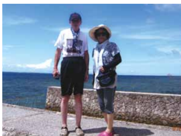
結婚40年を迎えて2回目のセブ旅行! 嫌がる主人を強引に連れ出しました♪

2回目のセブ旅行。前回と同じメンバーで、嫌がる主人を強引に連れ出す(結婚40年を迎えての事)。トリアスロンの大会のため外出できず、ショッピング、マッサージを堪能。とても気持ち良かった。船で1時間キルトの島(カオハガン島)でのバーベキュー。初めて見る貝でしたが、沢山おいしく頂きました。貝の殻は孫へのお土産にしました。4日目ボホール島へ。1268もの丘があるというチョコレートヒルはすごい!!チョコレート色したころまた来たい。また見学できたメガネ猿のターシャはあまりの小ささに目を血にして見入る。目が大きくてかわいい!!4日目はバディアンゴルフリゾートで一泊。カワサン滝のイカダに乗って滝の裏側へ。その後が大変!皆悲鳴を上げ滝に打たれ、思わず隣の人の手を握り、アッという間の出来事でした。日本に居てはできない体験でした。それから滞在中に食べた果物のおいしかった事。ドリアン・マンゴスチン・マンゴー・バナナ等の生ジュースと贅沢をさせて頂きました。帰りの税関ではちょっとしたハプニング。初めての事でビックリでしたが、手際よく対処して下さいました。仲間の方ありがとう!大変良くして下さいました。通訳さん、ドライバーさん、メイドさん、大変お世話になりました。台風で島巡りができなかったけれど、今回は充実した最高の旅でした。また同じ仲間とセブ島へ行きます。