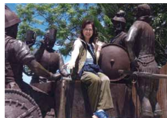
この旅の目的だった「のんびり、ゆったり」過ごすことで心身共にリフレッシュする事が出来ました

「いつか海外(旅行)に行こうね!」と夢を語り合った学生時代からの親友に誘われてセブ島2人旅が決まりました。ヤッター♪長年の夢が叶って心が弾みます。2日目はパンダノン島へ!船上では通訳のラチさんも一緒に「しりとり」をしながらあつという間に到着。どこまでも続く遠浅の海をのんびりお散歩してお昼はバーベQ!!地元のビール(サンミゲル)が美味しかったね!それからコーラルポイントリゾートのプールでひと泳ぎ。実は私「カナヅチ」でも「プカプカ浮いているだけでもイネ!」と大満足です。3日目は世界最小のお猿ターシャに対面、ちっちゃくてかわいい。大蛇はちょっと苦手。竹の吊り橋でスリルを味わい、その後地元フィリピン旅行者、欧米人も混じって生バンド有りのランチクルーズ。賑やかです。2人共お料理が口に合ってたネー。チョコレートヒルは意外に広く雄大な眺めでした。翌日はぶらりセブ市内へ移動して自由気ままにエステだ!ネイルを楽しんで最終日はたっぷり市内観光です。高台に道教寺院からサントニーニョ教会、スーパーでお買い物とティータイム。夜にはとても雰囲気のある店でフィリピン料理を大満喫!!ご馳走様でした。この旅の目的だった「のんびり、ゆったり」過ごすことで心身共にリフレッシュする事が出来ました。お世話になった皆さん、出会った皆さんの笑顔に感謝、感謝です。本当にありがとうございました。又ぜひマンゴーを食べに戻って来ますねー。