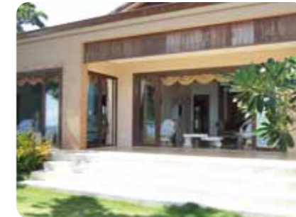
静寂の時間が流れるスペシャルビラ