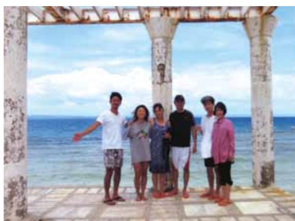
日本に居ては体験できない事ばかり! とても楽しい家族旅行になりました!

セブ島に旅行に行ってみて、日本に居ては感じる事ができない色々な感動や体験をする事ができました。1日目は真夜中にセブ島に着きました。セブ島に着いて感じたのは、空気がとてもムシムシしている事でした。長野では感じた事のない空気でした。そして通訳さんとドライバーさんと合流し、そのままコーラルポイントリゾートに行きました。行く途中は、日本とは全く違う光景ばかりでした。屋台の様なお店が道の両側に並んでいる風景が続き、野良犬も多く、不思議な風景でした。射撃体験を満喫、マリンスポーツもしました。パラセーリングとジェットスキーです。波の影響で楽しみにしていたシーウォーカーはできませんでしたが、パラセーリングとジェットスキーはとても楽しい思い出ができました。あまりアウトドアが好きではない自分も、いつの間にか半日が過ぎていました。パラセーリングでセブ島の海を眺めました。今まで見たことの無い光景で感動しました。他にも多くの体験をしましたが、日本に居ては体験できない事ばかりなので、とても楽しい旅行になりました。又、さよならパーティーでは言葉は通じなくても、音楽を通して共通した楽しい時間を過ごす事ができ、言葉を超えたコミュニケーションがある事も学ぶ事ができました。