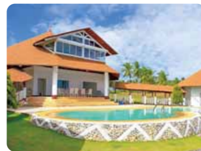
大海原を望むリゾートハウス