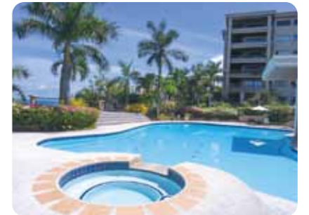
開放的で豪華絢爛な宿泊施設