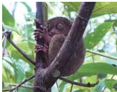
ボホール島へ1日観光! かわいいターシャにも会えました♪