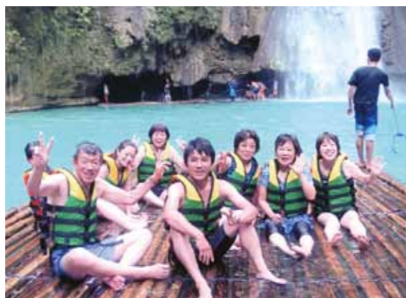
カワサン滝では、滝に打たれ大騒ぎして楽しみました!

家族4人と友達4人で猛暑の真っ只中、日本を脱出し、雨期と言われるセブ島に到着しました。3回目なので少し要領も良くなり、コーラルポイントリゾートに着く前にスーパーに寄り、地元のビール、つまみ、フルーツ(果物の王様と言われるドリアン・バナナ他)を買い、宿泊施設に向かいました。美味しいマンゴージュースを頂き、メイドさん達と花火見学をしました。週末は「トリアスロン」の世界大会が行われるとのこと、道路は整備され、道の両サイドには旗がなびき、今までとは違った感じでした。終日車規制となりバンカーボートでカオハガン島(キルト製作で有名な島)へ渡り、海水浴を楽しみました。昼のバーベキューでは、バケツ山盛りの貝やアワビ、シャコなどを頂き、大満足!!夕方からは昼間の疲れを取る為、全身オイルマッサージを受けました。4日目はボホール島へ1日観光。かわいいターシャにも会え、チョコレートヒルを見て自然界が作り出す神秘的な光景に感動しました。海が荒れていた為、バディアンゴルフリゾートで一泊し、カワサン滝では、滝に打たれ大騒ぎして楽しみました。今回もカモテスリゾートには行けなかったため、次回の楽しみもできました。日本で体験できない事にトライし、思い出深い旅行でした。通訳さん、ドライバーさん、メイドさん達のお陰です。本当にありがとうございました。