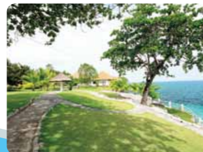
手付かずの自然が残るカモテスリゾート