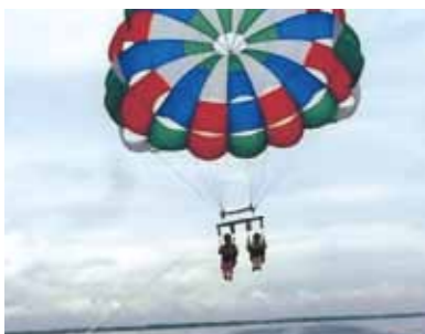
空から見たセブの海に感動! 今度は大きくなった息子と二人でパラセーリングを楽しみたいです