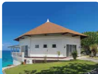
モデルハウスのテラスは海の上