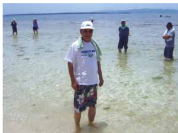
3年ぶりのセブの変化に驚きましたが、スタッフさんの対応はいつも変わらず笑顔で親切でした!

近所の新会員6名と妻の8名で、私が引率するような感じで久しぶりのセブ旅行を楽しんできました。8月のセブは雨期という事でしたが、雨にはほとんど遭わずに済み、素晴らしい旅行となりました。ワールドビッグフォー所有の施設があるカモテス島へは天候不順の為、断念しました。バンカーボートでの移動です、波の影響で帰りが心配ということでガイドさんの案内に従いました。その代わり近隣のパンダノン島に行き、海に入ったり、バーベキューを堪能しました。バディアンゴルフリゾートでは初めてゴルフクラブを握るという3名と6名でゴルフを楽しみ、夜は旅の疲れをとる為にマッサージをして頂き、帰りには私も初めてのカワサン滝を見学してきました。その後、セブ市内観光、ショッピング、フィリピン料理に舌鼓を打ち、最後にこれも初めてのニューハーフショーを鑑賞してきました。5回目、3年ぶりのセブ旅行で大きく変わったのは車の数が増えた事と、特にバイクが増えた事。又道路がほとんど舗装されていたことです。それに比べて変わらないのは通訳さん、メイドさん、ドライバーさん皆さんの対応がいつも笑顔で親切に接して頂いたことです。私も高齢なので今後行くことができるか分かりませんが、今後共々よろしくお願いします。一緒に同行した初めての皆さんも感心しておりました。スタッフの皆さん、本当に有難うございました。