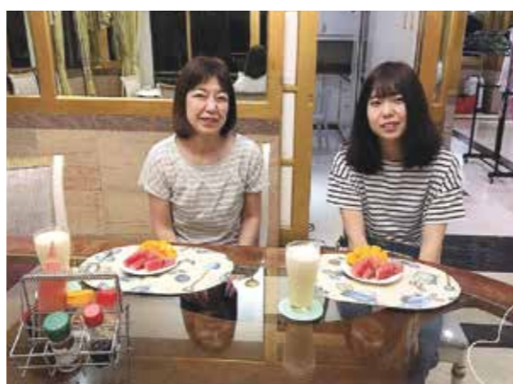
セブ島で食べたマンゴーとスイカはとても甘く、フレッシュで美味しかったです！！

祖母に誘われ、祖母と母と私と祖母の仲間7人でセブを満喫してきました。私は初めての海外だったので、不安もありましたが、国の気候だけでなく、通訳さん、メイドさん、ドライバーさんをはじめ、とても温かく親切で、安心して旅行を楽しむことができました。2日目は、ボホール島へ行きました。以前、祖母からメガネザルを見せたいと言われており、今回初めて見る事ができました。見てみると思っていたより小さくて、目がとても大きく、丸く、可愛らしいと思いました。その後、近くでココナッツジュースを飲みました。祖母と母と私の3人で飲みました。“すっきり”とした甘さで、初めて飲んで感動しました。その他、南国ならではのマンゴージュースやパイナップルを堪能しました。日本ではなかなか食べれないマンゴーは新鮮で、パイナップルは“シャキシャキ”で甘味があり大好きになりました。3日目はマリンスポーツを体験しました。特に印象に残っているものはパラセーリングです。南国の綺麗な景色の大空に飛び立つと、一面透き通る海や島々が広がっており、鳥になった気持ちでした。また、初めての体験で、ずっとわくわくどきどきでした。私は3泊4日だったので、まだまだセブ島の良い所の一部しか見れなかったと思います。今度はゆっくり優雅にセブ島を満喫したいです。連れて行ってくれた祖母、母、お世話になった現地の方々に感謝です。ありがとうございました。