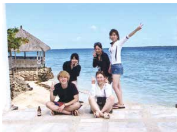
島めぐりの際は船を出してくれてパンダノン島へ!海がとても綺麗でたくさん写真を撮りました!

施設に到着して、たくさんのメイドさんが出迎えてくれて、とても驚きました。メイドさんたちは毎日美味しい朝食を作ってくれて、毎朝マンゴージュースやパイナップルジュースが飲めたので、体の調子が良くなりました。プールが4つあって驚きましたし、とても綺麗で、天気の良い日は気持ち良かったです。島めぐりの際は船を出してくれてパンダノン島まで送ってくれました。船の上では風が気持ち良かったです。島に到着すると、海がとても綺麗でたくさん写真を撮りました。体が透き通っている魚がたくさんいたり、小さなヤドカリと出会いました。お昼にはお肉や焼きイカ・エビ等が出て美味しかったです。射撃体験ができる場所に連れて行って貰い、本物の銃の重みと、撃ったときの反動が凄くて、良い体験ができました。夜景が見たいと頼んだら、『トプス』という所に連れて行ってきて、上の方から夜景を見る事ができ、とても綺麗でした。その日は曇っていて星は良く見えませんでした。雲の間から見えた星はとても近くに感じ、今度は雲が無いときに見に行きたいと思いました。帰国前日の朝がとても晴れて、朝が苦手な私でも、目を見開き外まで出て写真を撮ってしまうほど、凄く綺麗な景色が見れてとても感動しました!コーラルポイントリゾートに泊まる事が出来て、本当に良かったです。この素晴らしい思い出を作ることができたのは、通訳さん、ドライバーさん、メイドさん達のお陰です!ありがとうございました!!また遊びに来たいです!!