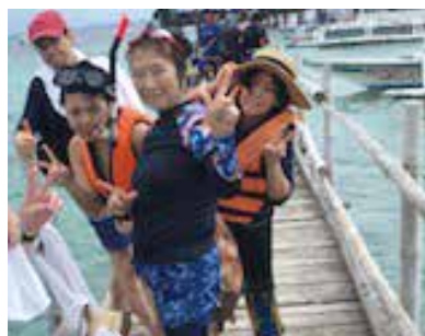
ナルスアン島では、ゆっくりとシュノーケリングでお魚たちとお話したりして、海遊びを楽しむことができて感激〜!