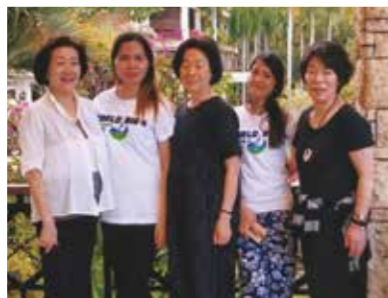
コーラルポイントリゾートではかわいいメイドさんにとっても親切にして頂き、本当に感謝しております!