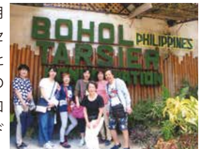
“百聞は一見に如かず”4時間足らずでマクタン・セブ空港へ着いた途端から色々分かってきた思いです！

近くに住む友人ご夫婦は毎年お正月3ヵ月を過ぎると寒い信州を離れてセブ7日間の旅に行かれます。羨ましいと指をくわえていた私に偶然セブ旅行のチャンスが巡って来たのです。友だち曰く、「貴女は、セブ旅行の為にワールドビッグフォーに入会したみたいね！」なんて言われましたが、突然夢が叶い、凄く嬉しかったです。“百聞は一見に如かず”とはよく言ったものです。“大富豪の別荘”などと言われてもピンときません。“何万坪の敷地”などと言われてもピンときません。4時間足らずでマクタン・セブ空港へ着いた途端から色々分かってきた思いです。名前も知らない美しい、芳しい香りの花々や、南国情緒満点のリゾート別荘。メイドさん、食べ物、セブ島での開発現場。夜のフィリピンの街並み。生活している人々。次々と出来る国際空港の意味、本当に目から頭に飛び込んで来て、楽しい面白い世界の一片を見たような強烈な思いでした。中3日の旅。歳を忘れ“大いに楽しもうよ”の参加者7人の合言葉で充実した毎日でした。マリンスポーツ。ボホール島で見たメガネザル。円錐形の丘。クルージング。ショッピング。毎日何かと雑事に追われている私ですが、ホッとした時、74才にもなってこんな良い旅をさせて頂いて感謝・感謝です。ありがとうございました。