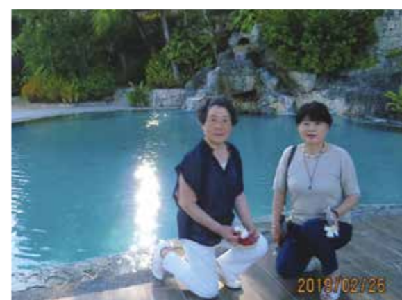
名前も知らない美しい、芳しい香りの花々や、南国情緒満点のリゾート別荘！こんな良い旅をさせて頂いて感謝・感謝です！

近くに住む友人ご夫婦は毎年お正月3ヵ月を過ぎると寒い信州を離れてセブ7日間の旅に行かれます。羨ましいと指をくわえていた私に偶然セブ旅行のチャンスが巡って来たのです。友だち曰く、「貴女は、セブ旅行の為にワールドビッグフォーに入会したみたいね！」なんて言われましたが、突然夢が叶い、凄く嬉しかったです。“百聞は一見に如かず”とはよく言ったものです。“大富豪の別荘”などと言われてもピンときません。“何万坪の敷地”などと言われてもピンときません。4時間足らずでマクタン・セブ空港へ着いた途端から色々分かってきた思いです。名前も知らない美しい、芳しい香りの花々や、南国情緒満点のリゾート別荘。メイドさん、食べ物、セブ島での開発現場。夜のフィリピンの街並み。生活している人々。次々と出来る国際空港の意味、本当に目から頭に飛び込んで来て、楽しい面白い世界の一片を見たような強烈な思いでした。中3日の旅。歳を忘れ“大いに楽しもうよ”の参加者7人の合言葉で充実した毎日でした。マリンスポーツ。ボホール島で見たメガネザル。円錐形の丘。クルージング。ショッピング。毎日何かと雑事に追われている私ですが、ホッとした時、74才にもなってこんな良い旅をさせて頂いて感謝・感謝です。ありがとうございました。