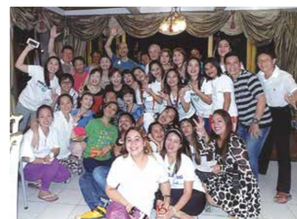
夜のパーティーでのダンスはサイコー! 愛らしいメイドさん、通訳さんに感謝!

何回目か忘れる程、毎年セブを訪れます。毎回違う部屋に泊まるのも楽しみで、今年は初めての4階。とてもゴージャス。各階に必ず天使と宝玉を持った龍神が飾られ、強い守護を感じます。主人の部屋は天使だらけ。ワールドビッグフォーが30年続く理由が分かる気がします。メイドもクリスチャンで部屋のドアにマリア様、お土産店でもバイバイパーティー会場にいてもマリア様を見ます。今年は我が家の神様を連れて共に旅をしました。朝5時前、暗いうちからシャワーを浴び、心身を浄化し、日の出を待ちます。毎日素晴らしい光景。黄金色に光る海面が今回七色に変化し、息を飲む程美しい!!それを見逃しませんでした。少し明るくなると花をとりりに散歩。それから部屋でプージャ(供え物、お花を神に捧げ、祈る伝統儀式)し、神様が花でうまります。皆の健康、幸せ平和、旅の安全を祈りました。あたたかく甘い南国の風と花々、珍しい鳥、波の音…。アートマ(魂)の世界が発展し、8時の朝食まで、自由な静かで美しい、まさに至福の時間が流れていきます。夜、マッサージのお姉さん、テーブルの神様をみて「オーゴッド!サントニーニョ」セブではサントニーニョは幼きイエス像。自分に必ず奇跡が起こると信じられている。インドでは、クリシュナ。ドイツではギリギリ。呼び名は違っても、愛が人を結びつけ調和と喜び世界が広がっていくのは世界共通です。愛らしいメイドさん通訳さんに感謝♥美しきセブにまた来ます!!P.S夜のダンスもモチロン最高wwwパラダイス!