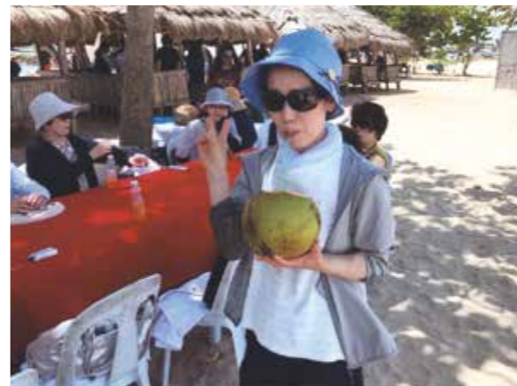
船で訪れた無人島でのひととき~♪忙しい毎日から解放され、のんびり過ごせた一週間でした!

初めての海外旅行がセブ島でした。忙しい毎日から解放され、のんびり過ごせた一週間でした。すばらしい天気にも恵まれ、マリンスポーツ、チョコレートヒルズ観光、展望台(トップス)からの夜景、世界一小さな猿(ターシャ)の見物等々、疲れを感じる暇もないくらい「てんこもり」のスケジュールでした。