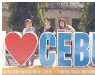
念願のメガネザル見学をしたり、マリンスポーツでは“わくわくどきどき”でした。またセブ島に行きたいと思える写真です！