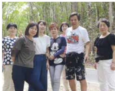
今回は5日間でしたが、毎日が楽しく、あつと言う間でした！7人が仲良く、本当の家族のようで、幸せでしたよ！