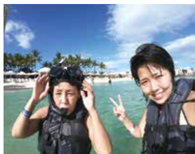
シュノーケルを付けて海に入ると、小さな魚たちがたくさん泳いでいて、それを追いかけて、いつまでも見ていたいと思いました!