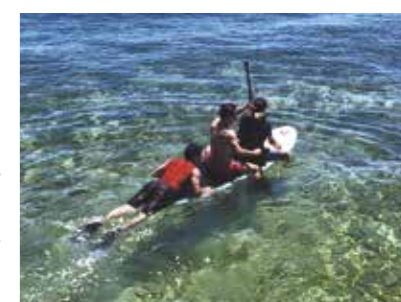
新しい発見の一つ、初サーフボードにも挑戦!難しかったですが大はしゃぎしました!

二年連続で遊びに行かせてもらいました!今年は私が六ヵ月間、セブ島にある語学学校へ通っていたので、最後の締めとして遊びに行きました。長期滞在していたので、「新たな発見と楽しみはなんだろう?」と想着ていましたが、なんと新しい遊びを見つけました。それは、サーフボードと魚獲りです。初めてのサーフボードは難しかったですが、家族みんなだけでなく、メイドさんもう一緒になって大はしゃぎしました。もう一つの魚獲りは、サーフボード以上の大盛り上がりをしました。最初は手づかみで行っていたのですが、網が来てからは、メイドさんも家族も大人の大人がキャッ!キャ!しながら時間を忘れ楽しみました。たった数分かと思いきや、2時間近く魚獲りをしていました。結果は大量の小魚と近くの漁師さんからもらった魚で大漁でした。すっかり日焼けしてしまいましたが、すべて良い思い出です。来年行く時は一人一つの網と保存用の籠を買って.....と話すほど熱中しました(笑)。勿論、言う必要もないが、メイドさん、運転手さん、通訳さん、全ての方々の対応はとても良く、快適な休日を過ごす事ができました。感謝感謝です。また来年もこれからずっとお世話になります!!