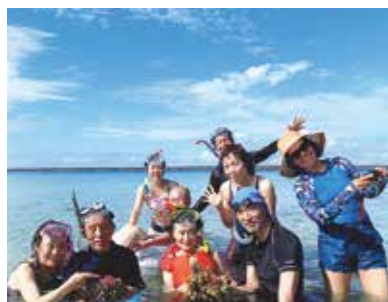
サンゴがぎっしり敷き詰められた海でシュノーケリング、本当に足を延ばして良かった!