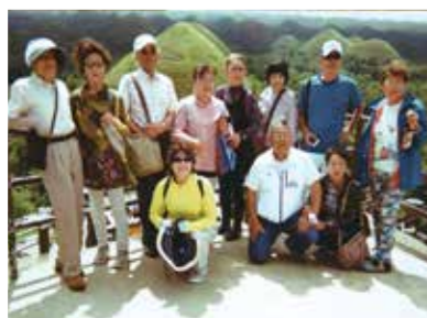
水に恵まれているボホール島が、ますますきれいに豊かになってきているように感じました!