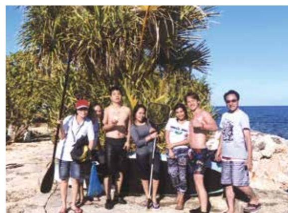
家族みんなだけでなく、メイドさんと一緒に魚獲りに熱中しました!

二年連続で遊びに行かせてもらいました!今年は私が六ヵ月間、セブ島にある語学学校へ通っていたので、最後の締めとして遊びに行きました。長期滞在していたので、「新たな発見と楽しみはなんだろう?」と想着ていましたが、なんと新しい遊びを見つけました。それは、サーフボードと魚獲りです。初めてのサーフボードは難しかったですが、家族みんなだけでなく、メイドさんもう一緒になって大はしゃぎしました。もう一つの魚獲りは、サーフボード以上の大盛り上がりをしました。最初は手づかみで行っていたのですが、網が来てからは、メイドさんも家族も大人の大人がキャッ!キャ!しながら時間を忘れ楽しみました。たった数分かと思いきや、2時間近く魚獲りをしていました。結果は大量の小魚と近くの漁師さんからもらった魚で大漁でした。すっかり日焼けしてしまいましたが、すべて良い思い出です。来年行く時は一人一つの網と保存用の籠を買って.....と話すほど熱中しました(笑)。勿論、言う必要もないが、メイドさん、運転手さん、通訳さん、全ての方々の対応はとても良く、快適な休日を過ごす事ができました。感謝感謝です。また来年もこれからずっとお世話になります!!