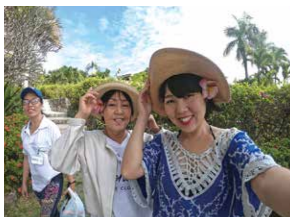
娘に連れられて、初めてのフィリピン・セブ島を楽しみました!毎日くたくたになるまで遊べて、夢のような4日間でした!

娘に連れられて、初めてのフィリピン・セブ島を楽しみました。特に買い物では物価が安い為、たくさんのお土産を眺めると、どれもデザインがかわいらしくて、特にラブラブ公園で買った魚の置き時計が貝の加工品でとてもキレイで気に入っています。時計を見る度に旅行の思い出をふりかえり、楽しい気持ちになったのは、娘が海の中で見た世界を伝えてくれて、私も見てみたいと思いました。シュノーケルを付けて海に入ると、小さな魚たちがたくさん泳いでいて、それを追いかけて、いつまでも見ていたいと思いました。セブの気候とキレイな海は長年忘れていた開放的な好奇心を思い出させてくれました。他にも、スパやネイルをしたり、美味しいフィリピン料理を食べたり、毎日くたくたになるまで遊べて夢のような5日間でした!あつという間に過ぎてしまいましたが、今度は息子夫婦も連れてみんなで行けたらと思います。素晴らしい旅行をありがとうございました。