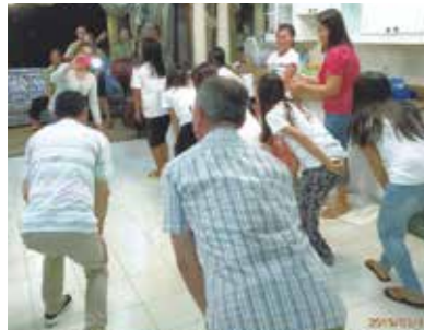
パーティーは大爆笑の渦! 食べ過ぎたのか、笑いすぎたのか、お腹が痛くなる程でした(笑)