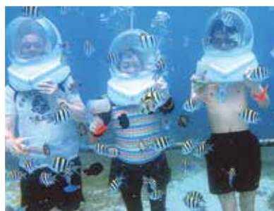
家の事を忘れて楽しんだ5日間はまるで竜宮城に行ったような毎日でした!