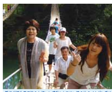
孫娘が誕生日で皆のお祝いに感動!カワサン滝の竹のイカダに乗りスリルを味わい、ボホール島観光も満喫、セブの夜景も美しかったです