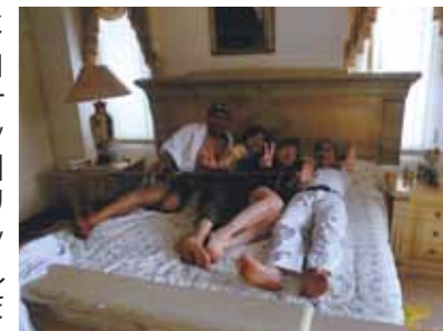
滞在期間中すべて自由時間!マリンスポーツや島巡りを満喫、買い物やエステ、マッサージにダンス等も楽しみました

昨年続き2回目のセブです。メイドさん達の「おかえりなさい」の笑顔に迎えられました。さっそく楽しみの部屋選び、オイルマッサージで疲れを取りました。8日にはマリンスポーツ(パラセーリング、バナナボート、シーカヤック、シーウォーカー)を楽しみました。シーウォーカーは心臓が止まりそうな位緊張したけれど、海に入るとすっかりそんな事は忘れてしまい、色とりどりの熱帯魚に心ときめきました。9日は船で約1時間の島へバーベキューに向かいました。砂浜が長く続き、手慣れたメイドさん達のフィリピン料理に満足しました。帰るとさっそくジェルネイルに行きました。ここで私の失敗談、何もかもさっそく嬉しくてウキウキしてしまい暴飲暴食してしまいました。ダンスから帰って体調を壊してしまい、その夜は一晚中苦しみました。次の日も動けなくてお灸をしていただいたり、マッサージしてもらったり、皆さんには心配をかけてしまい本当に申し訳なかったです。後半は他の方達も体調を壊したりしたので、コーラルポイントリゾートでのんびりしました。プールで遊んだり、デパートやスーパーに行ったり、エステに行ったり、のんびり話をしたり、ほとんど毎日ダンスも出来たし(笑)セブの男性はダンスがすごく上手なんです。「こんなゆったりセブもいいな」私には最高に楽しめたセブでした。最後のお別れパーティーでは全員元気にダンス三昧です。踊って踊って踊りまくりました。このまま時間が止まってほしいと思いました。こんな不良中年に毎晩夜遅くまで付き合ってくれたりサさん、ドライバーさん、メイドさん本当にありがとうございました。地平線に顔を出した朝日は光輝いてすばらしく素敵でした。アイラブセブ!来年は何から始めましょう(^_^)♪♪♪