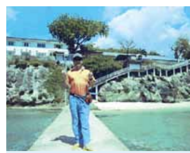
元気をもらったセブの旅、最高の思い出になりました！海、空の美しさには本当に感動しました。又、近い内にぜひセブ島に行きたいです

以前からセブ島のお話を伺い、いつかは行ってみたいと思っていましたが、今年3月で定年退職となる機会に休暇を取り、家内と二人でセブ島を訪れました。現地で先に出発していた4名の方と合流し、6人で毎日行動をともにしました。まず驚いたことが、海、空の美しさです。コーラルポイントリゾートを始め、バディアンゴルフリゾートの美しさは言葉に表せません！本当に感動しました。今回どうしてもやりたかったことがマリンスポーツです。シーウォーカーで魚達との触れあい、バナナボートでのスリル、パラセーリングでの空の散歩は自分が鳥になったような気分でした。夢のような5泊6日でした。最後の日のさよならパーティーでは大いに盛り上がり、時間の経つのを忘れてメイドさん達と踊っていました。明るく元気なメイドさん達に、元気をお願いありがとうございました。又、近い内にぜひセブ島に行きたいです。スタッフの皆さんありがとうございました。