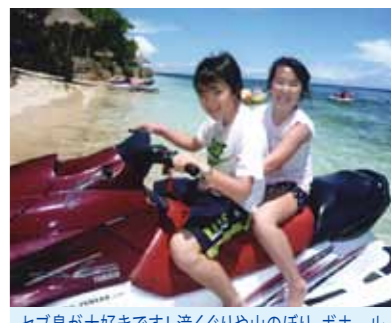
セブ島が大好きです!滝くぐりや山のぼり、ボホール島観光にマリンスポーツ、またいきたいとおもいました

ぼくは、初めて海外旅行へいきました。7泊8日という長い日々をおじいちゃん、おばあちゃん、お母さん、妹、ぼくで過ごしました。セブ島では、いろいろな事がありました。ある日は滝をくぐり、またある日は山へのぼり景色をみました。セブ島で一番心にのこったのは、パラセーリングです。最初はふあんだっただけけれど、やってみると、そんなこわくはありませんでした。ほかに、バナナボートやシーウォーカーなど、どれもおもしろい物ばかりでした。ボホール島では、めがねザルをけんがくしたり、写真をとったりしました。とってもかわいかったです。初めての海外旅行でいろいろしゃべりだっただけけれど、ガイドの人がやさしくせってくれたりして、とってもあんしんしました。ぼくがコーラルポイントリゾートにいれば、コーラルポイントリゾートのメイドさんたちが笑顔でむかえてくれたり、うんてんしゅさんは、どこへでもつれていってくれたりしました。ぼくはそんなセブ島が大好きです。またいきたいとおもいました。セブ島のガイドさん、うんてんしゅさん、メイドさん7泊8日というみじかいあいだでしたが、いろいろお世話になりました。ありがとうございました。