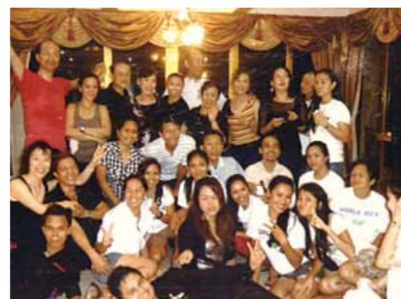
神秘なるセブ 4回目の発見!!セブは神の贈り物♡天国のような楽しい時間と気づきをもたらすワンダーランド

セブは、至る所にエンジェルの置物が目につく。部屋にもなんと、私の大好きな大天使ハニエルが♡♡信州の2月は寒いがここは快適。コーラルポイントリゾートA棟6階のベランダは、朝ヨガに最高です。朝4時、一番鳥が鳴き静かな時間が流れる。風と波のリズム、そこに加わる犬の声、鳥のさえずり、ハトの羽ばたき、自然界の音がオーケストラのように私の全存在に響きわたる。呼吸が宇宙の鼓動に同期し、あらゆるものが調和している。刻一刻と変化していくその色彩、大自然は神秘を映す鏡。曇り空からさえ降り注ぐ光にキラキラ輝く海の美しい事!その神秘をもらさず意識していると正直日本を、仕事、家族、心配事をすっかり忘れてしまう。そのかわりいつも見逃している奇跡や不思議な世界がみえる。例えば、①後頭部をうち夜中も痛かった仲間が無事な理由。②トイレに座していると30cmの距離に白いハトと黒いハトが仲良くとまり、メッセージと祝福をくれた♡。③夫の誕生日を毎年仲間と共にセブで祝う幸運。入会以来豊かさをエンジョイしている私達。④毎夜若いダンサー達と過ごす甘味なひととき。そして朝ヨガ三昧で忘れていた過去生を思い出した、この秋、ヨガ35周年の秘密♡瞑想の中で美しい蝶々が沢山現れた。「神の贈り物はすぐわかる!」と謎の言葉を残して消えた女神。セブは神の贈り物♡天国のような楽しい時間と気づきをもたらすワンダーランド。ありがとう神様。来年は妖精に逢いにきます。神秘なるセブに合唱♡