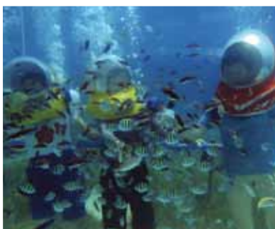
心身共にリフレッシュ出来ました!シーウォーカーで魚の群れに囲まれてしばしの間 夢ごこちなり