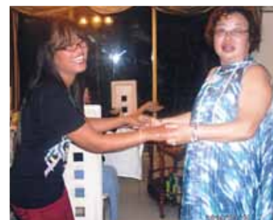
楽しかったセブ旅行、さよならパーティーも楽しかったです！今度は娘や孫達もいつか連れて来たいなと密かに思いました