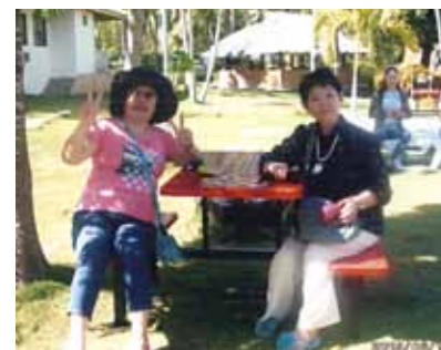
イヤリングとピアスのお土産はとても喜ばれ、ちょっと自慢でした！私の体はセブ島に合っている様で、ここに住もうかと思案中です