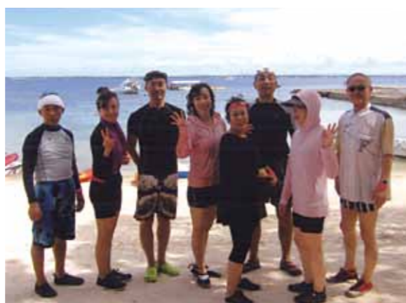
人生観が変わるセブ島!これから皆で、シーウォーカー、パラセーリング、バナナボート、シーカヤック、ビーチシュノーケルです