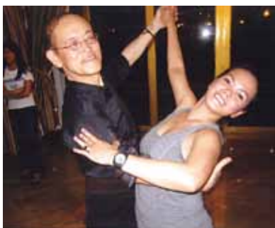
さよならパーティーで、格好良くポーズ!セブ島に夢のような旅行が出来る皆様へ感謝、次回は半分遊び、半分ゆったり過ごしたいと思ひます