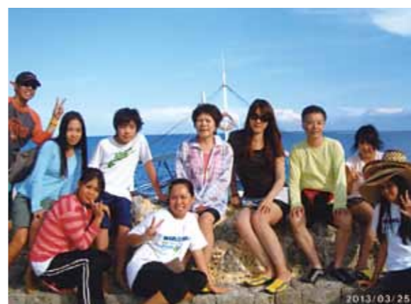
家族で再びセブを訪れる事を夢見て...!孫達は朝からプールに海と泳ぎ、朝食を頂いて毎日の行程をスタート!バディアンゴルリゾートへ行き、カワサン滝の竹のイカダに乗りスリルを味わった。