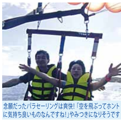
念願だったパラセーリングは爽快!「空を飛ぶってホントに気持ちいいものですね!」やみつきになりそうです