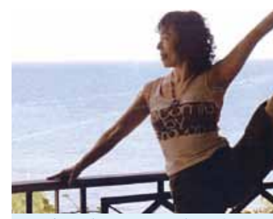
コーラルポイントリゾートA棟6階のベランダは、朝ヨガに最高です!自然界の音がオーケストラのように私の全存在に響きわたる

セブは、至る所にエンジェルの置物が目につく。部屋にもなんと、私の大好きな大天使ハニエルが♡♡信州の2月は寒いがここは快適。コーラルポイントリゾートA棟6階のベランダは、朝ヨガに最高です。朝4時、一番鳥が鳴き静かな時間が流れる。風と波のリズム、そこに加わる犬の声、鳥のさえずり、ハトの羽ばたき、自然界の音がオーケストラのように私の全存在に響きわたる。呼吸が宇宙の鼓動に同期し、あらゆるものが調和している。刻一刻と変化していくその色彩、大自然は神秘を映す鏡。曇り空からさえ降り注ぐ光にキラキラ輝く海の美しい事!その神秘をもらさず意識していると正直日本を、仕事、家族、心配事をすっかり忘れてしまう。そのかわりいつも見逃している奇跡や不思議な世界がみえる。例えば、①後頭部をうち夜中も痛かった仲間が無事な理由。②トイレに座していると30cmの距離に白いハトと黒いハトが仲良くとまり、メッセージと祝福をくれた♡。③夫の誕生日を毎年仲間と共にセブで祝う幸運。入会以来豊かさをエンジョイしている私達。④毎夜若いダンサー達と過ごす甘味なひととき。そして朝ヨガ三昧で忘れていた過去生を思い出した、この秋、ヨガ35周年の秘密♡瞑想の中で美しい蝶々が沢山現れた。「神の贈り物はすぐわかる!」と謎の言葉を残して消えた女神。セブは神の贈り物♡天国のような楽しい時間と気づきをもたらすワンダーランド。ありがとう神様。来年は妖精に逢いにきます。神秘なるセブに合唱♡