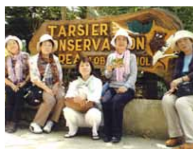
あつという間の5泊6日の旅、本当に楽しい日々でした!又機会があったら行ってみたいと思ひます。ありがとうございました

少し不安で思い切れなかったけど、友人仲間が良かったので思い切って連れて行って頂きました。成田から4時間、セブ・マクタン空港へ到着した時は夜だったので、景色はわかりませんでした。翌日の朝、コーラルポイントリゾートA棟6階から見た青い海と朝日がとてもきれいで、別世界へ来たかの様に感激しました。朝食はいつもマンゴやパイナップル、バナナ、パイヤがあり、美味しいジュースの味は忘れられません。日本ではとても味わう事が出来ません。2日目はパンダノン島の白い砂浜でバーベキューや海に入って魚を見たり貝拾いをして楽しみました。3日目はボホール島に行き、初めてバナナの花を見ました。そして小さなメガネ猿がとても可愛かったです。4日目のシーウォーカー体験は少々怖かったけど、きれいな珍しい魚の群れの中楽しかった。パラセーリングは広い海を上から見下ろした時の心地良かった事...最高!!最終日前日は、JWBホテルを見学し、施設の豪華さに驚きました。ショッピングを楽しみ、フィリピン料理もとても美味しかったです。最後の夜はサヨナラパーティー、生バンドの演奏で賑やかな雰囲気の中、スタッフのダンスなどで会場内は大盛り上がりとなり、本当に楽しい日々で5泊6日の旅は、あつという間に過ぎてしまいました。又機会があったら行ってみたいと思ひます。ガイドさん、ドライバーさん、メイドさんお世話様でした。ありがとうございました。