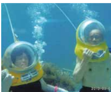
あっと言う間の8日間、童心に戻り思う存分楽しみました!パラセーリングはドキドキ、シーウォーカーでは魚達と一緒に記念撮影しました