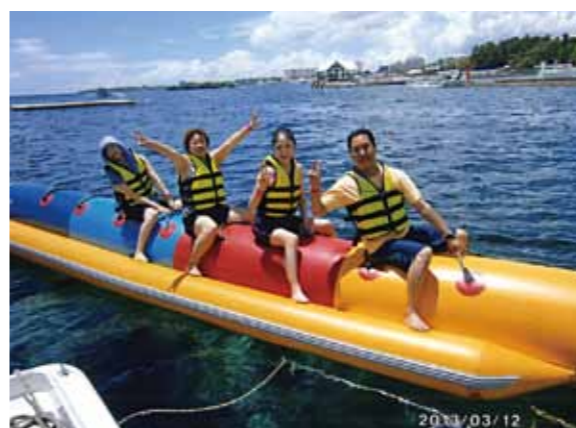
夢のような5泊6日！シーウォーカーで魚達との触れあい、バナナボートでのスリル、パラセーリングでは自分が鳥になったような気分でした

以前からセブ島のお話を伺い、いつかは行ってみたいと思っていましたが、今年3月で定年退職となる機会に休暇を取り、家内と二人でセブ島を訪れました。現地で先に出発していた4名の方と合流し、6人で毎日行動をともにしました。まず驚いたことが、海、空の美しさです。コーラルポイントリゾートを始め、バディアンゴルフリゾートの美しさは言葉に表せません！本当に感動しました。今回どうしてもやりたかったことがマリンスポーツです。シーウォーカーで魚達との触れあい、バナナボートでのスリル、パラセーリングでの空の散歩は自分が鳥になったような気分でした。夢のような5泊6日でした。最後の日のさよならパーティーでは大いに盛り上がり、時間の経つのを忘れてメイドさん達と踊っていました。明るく元気なメイドさん達に、元気をお願いありがとうございました。又、近い内にぜひセブ島に行きたいです。スタッフの皆さんありがとうございました。