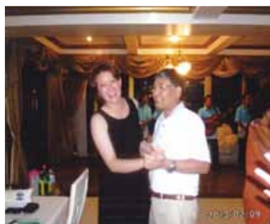
この幸せな顔!! 我が娘の様に、生まれた時からずっつと成長を楽しみにしていた子とダンスです