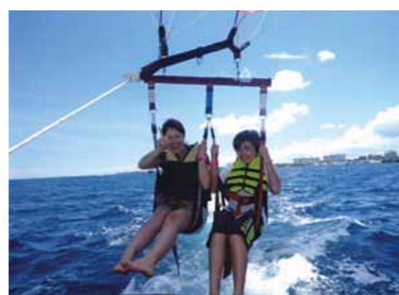
セブ島で一番心にのこったのは、パラセーリングです!バナナボートやシーウォーカーなど、どれもおもしろい物ばかりでした

ぼくは、初めて海外旅行へいきました。7泊8日という長い日々をおじいちゃん、おばあちゃん、お母さん、妹、ぼくで過ごしました。セブ島では、いろいろな事がありました。ある日は滝をくぐり、またある日は山へのぼり景色をみました。セブ島で一番心にのこったのは、パラセーリングです。最初はふあんだっただけけれど、やってみると、そんなこわくはありませんでした。ほかに、バナナボートやシーウォーカーなど、どれもおもしろい物ばかりでした。ボホール島では、めがねザルをけんがくしたり、写真をとったりしました。とってもかわいかったです。初めての海外旅行でいろいろしゃべりだっただけけれど、ガイドの人がやさしくせってくれたりして、とってもあんしんしました。ぼくがコーラルポイントリゾートにいれば、コーラルポイントリゾートのメイドさんたちが笑顔でむかえてくれたり、うんてんしゅさんは、どこへでもつれていってくれたりしました。ぼくはそんなセブ島が大好きです。またいきたいとおもいました。セブ島のガイドさん、うんてんしゅさん、メイドさん7泊8日というみじかいあいだでしたが、いろいろお世話になりました。ありがとうございました。