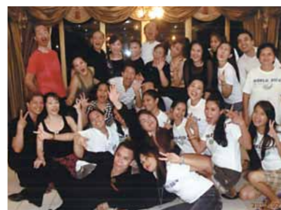
私には最高に楽しめたセブでした!お別れパーティーでは全員元気にダンス三昧、このまま時間が止まってほしいと思いました

昨年続き2回目のセブです。メイドさん達の「おかえりなさい」の笑顔に迎えられました。さっそく楽しみの部屋選び、オイルマッサージで疲れを取りました。8日にはマリンスポーツ(パラセーリング、バナナボート、シーカヤック、シーウォーカー)を楽しみました。シーウォーカーは心臓が止まりそうな位緊張したけれど、海に入るとすっかりそんな事は忘れてしまい、色とりどりの熱帯魚に心ときめきました。9日は船で約1時間の島へバーベキューに向かいました。砂浜が長く続き、手慣れたメイドさん達のフィリピン料理に満足しました。帰るとさっそくジェルネイルに行きました。ここで私の失敗談、何もかもさっそく嬉しくてウキウキしてしまい暴飲暴食してしまいました。ダンスから帰って体調を壊してしまい、その夜は一晚中苦しみました。次の日も動けなくてお灸をしていただいたり、マッサージしてもらったり、皆さんには心配をかけてしまい本当に申し訳なかったです。後半は他の方達も体調を壊したりしたので、コーラルポイントリゾートでのんびりしました。プールで遊んだり、デパートやスーパーに行ったり、エステに行ったり、のんびり話をしたり、ほとんど毎日ダンスも出来たし(笑)セブの男性はダンスがすごく上手なんです。「こんなゆったりセブもいいな」私には最高に楽しめたセブでした。最後のお別れパーティーでは全員元気にダンス三昧です。踊って踊って踊りまくりました。このまま時間が止まってほしいと思いました。こんな不良中年に毎晩夜遅くまで付き合ってくれたりサさん、ドライバーさん、メイドさん本当にありがとうございました。地平線に顔を出した朝日は光輝いてすばらしく素敵でした。アイラブセブ!来年は何から始めましょう(^_^)♪♪♪