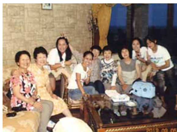
初めてのセブ旅行、別世界へ来たかの様に感激しました!パンダノン島やボホール島観光、マリンスポーツ等も堪能しました

少し不安で思い切れなかったけど、友人仲間が良かったので思い切って連れて行って頂きました。成田から4時間、セブ・マクタン空港へ到着した時は夜だったので、景色はわかりませんでした。翌日の朝、コーラルポイントリゾートA棟6階から見た青い海と朝日がとてもきれいで、別世界へ来たかの様に感激しました。朝食はいつもマンゴやパイナップル、バナナ、パイヤがあり、美味しいジュースの味は忘れられません。日本ではとても味わう事が出来ません。2日目はパンダノン島の白い砂浜でバーベキューや海に入って魚を見たり貝拾いをして楽しみました。3日目はボホール島に行き、初めてバナナの花を見ました。そして小さなメガネ猿がとても可愛かったです。4日目のシーウォーカー体験は少々怖かったけど、きれいな珍しい魚の群れの中楽しかった。パラセーリングは広い海を上から見下ろした時の心地良かった事...最高!!最終日前日は、JWBホテルを見学し、施設の豪華さに驚きました。ショッピングを楽しみ、フィリピン料理もとても美味しかったです。最後の夜はサヨナラパーティー、生バンドの演奏で賑やかな雰囲気の中、スタッフのダンスなどで会場内は大盛り上がりとなり、本当に楽しい日々で5泊6日の旅は、あつという間に過ぎてしまいました。又機会があったら行ってみたいと思ひます。ガイドさん、ドライバーさん、メイドさんお世話様でした。ありがとうございました。