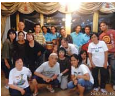
素晴らしい思い出の記念日になりました!最後の夜のパーティーもメイドさん達と踊りまくり、とても楽しい7泊が終わりました