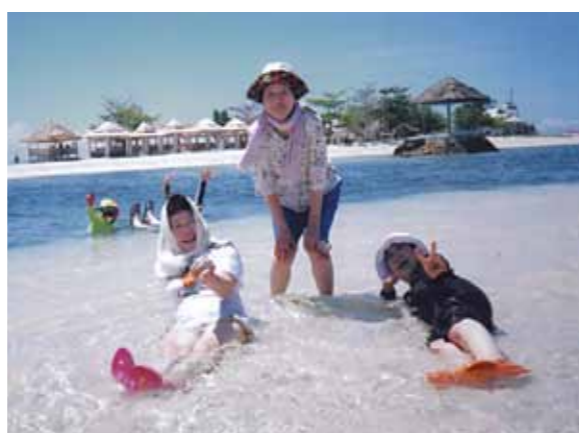
夢のような日々は、あつと言う間に!セブ島のエメラルドグリーンの海に入り 優雅な気分 に 浸りておりぬ