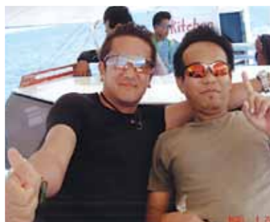
次回は家族と一緒に世話になります!シーウォーカー・パラセーリング・ボホール島ツアー・パンダノン島と至福の時でした