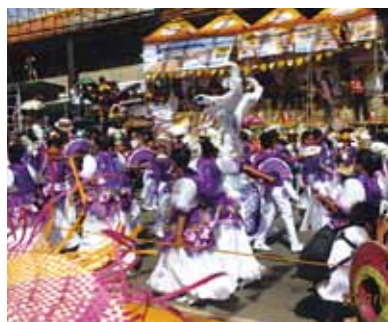
パレードがすごい! 子供達がきれいに化粧したりドレスアップし、踊っています。次々に現れる隊列、楽団もついでにきます