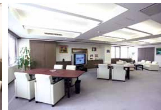
南向きで日当たりも良好な室内