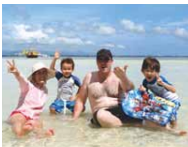
6歳と4歳の子供達も解放感にはしゃぐ毎日! 日帰りの船旅でBBQをいただき、素晴らしい海と戯れることができました