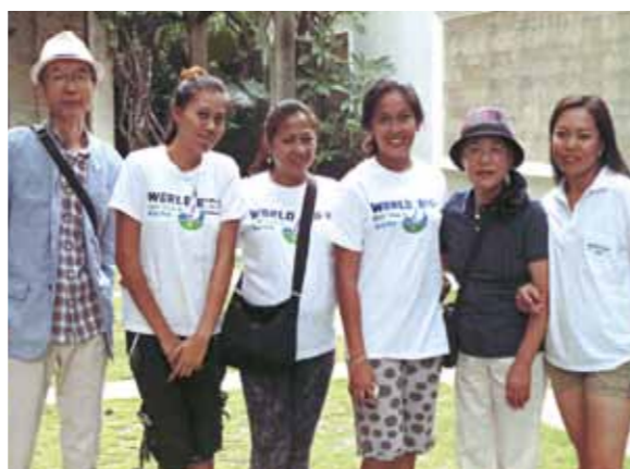
夫婦初の海外旅行、贅沢で優雅な体験になりました！市内観光等、定番の観光コースを堪能、ボホール島も満喫しました

今回は夫婦では初の海外旅行でした。初日はセブ・マクタン空港着が遅かったため、フィリピン料理で食事のみ。2日目はサンペドロ要塞・サントニーニョ教会・マゼランクロス・射撃・トップス展望台の夜景・ショッピングと定番の観光コースを堪能し、夜は中華料理を楽しみました。3日目は高速艇でボホール島のタグビラランポートに渡り、駆け足ではありましたが、血盟同盟記念碑・旧富豪の邸宅・ロボクリバークルーズ(昼食バイキング)・チョコレートヒル・ターシャ・竹橋・バクラヨン教会を満喫できました。実質的な最終日4日目は快晴の空の下、小島のハウスでバーベキューを楽しみました。浜辺を散策し、美しい貝殻などを拾い、ビデオや写真を撮影しながらゆったりとした時間を、のんびりと過ごすことができました。ガイドさんを含め8人もスタッフの皆さんによる、我々二人だけのためのサービスが何とも贅沢で優雅な体験になりました。全日お付き合い頂いたガイドさん・運転手さん・それに食事・掃除・洗濯等大変お世話になったメイドさん達には心から感謝します。現地で覚えたビサヤ語はわずかに1つ、メイドさんが教えてくれた「マアヨン ブンタク(おはようございます)」のみでした。今回はもっと言葉を覚え、ダイビング・パラセーリングとアクティブに、時にはまったりと楽しみたいなどと、欲張りなプランがすでに頭をもたげているのです。