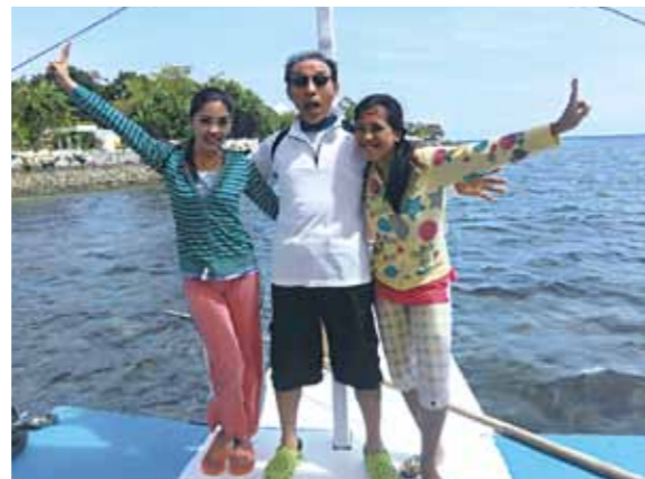
マリンスポーツにチャレンジ! 水上バイクでは、スリル感と満足感が味わえ最高! 仲間とパラセーリングやバナナボート、ダイビングにも挑戦しました