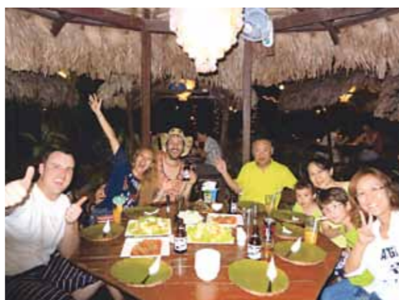
セブ島での家族集合、完全にリフレッシュ!! 心ゆくまで快適に笑顔で過ごせたこと本当に感謝でいっぱいです

今回セブ旅行1回目です。両親に誘われて、アメリカからの妹夫婦と家族合同の旅になりました。11月初めから9日間の旅行でした。日本での忙しさを忘れ、完全にリフレッシュをして帰国することができました。母として妻としてメイドさん達に、こんなに良くしていただいたことに戸惑いと感謝でいっぱいです。6歳と4歳の子供達も解放感にはしゃぐ毎日でした。フィリピン料理の店にドライバーさん、ガイドさんに何度か連れて行ってもらいましたが、日本人の口に合うおいしい料理で心もお腹も満足でした。コーラルポイントリゾートにある海水プールや海にも入り泳ぎました。セブ市内のマッサージに2度行きましたが、信じられない価格で最高のリラックスを味わえました。滞在中、ツイスター・台風と自然災害の危険にさらされ、荒れた町を目の前にしました。でもガイドさんからの心遣いで落ち着いて旅を楽しみ続けることができました。日帰りの船旅でBBQ(メイドさん手作り)をいただき、素晴らしい海と戯れることができましたが、カモテス島に行けなかったことは残念でした。次回の楽しみにします。朝一番の生マンゴジュース、天国でした。皆さんに守られて、心ゆくまで快適に笑顔で過ごせたこと本当に感謝でいっぱいです。ガイドさん、メイドさん、ドライバーさんありがとうございました。