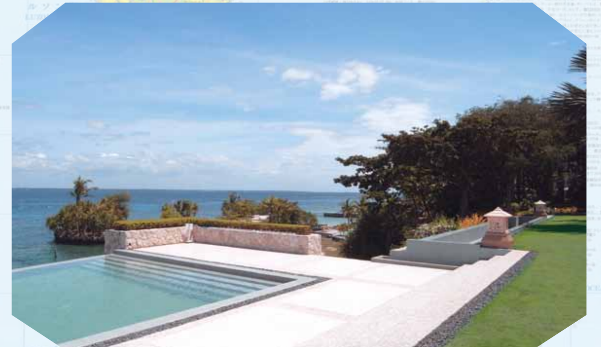
大自然が誘うコーラルポイントリゾート・スペシャルビラからの景観