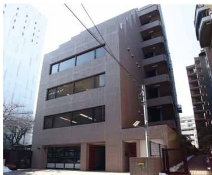
湯島大同ビル外観

いつも温かいご支援を頂き、誠にありがとうございます。 ジャパンエアリゾートインターナショナル株式会社、並びにワールドビッグフォー本部事務局は、業務拡張の為、先にご案内しましたとおり、順次進めてまいりました事務局移転が完了し、平成26年1月20日より全面的に新事務局での業務を開始しましたので、お知らせします。 移転期間中は、皆様にはご不便をおかけしましたこととお詫び申し上げます。これからも変わらぬご愛顧のほどよろしくお願い致します。