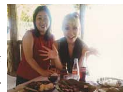
凄く良い癒しの旅になりました♡ また時間がとれたら今度はゆっくり旅行に行きたいと思います