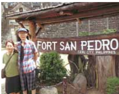
今回はもっとアクティブに、時にはまったりとセブを楽しみたい！欲張りなプランがすでに頭をもたげているのです。