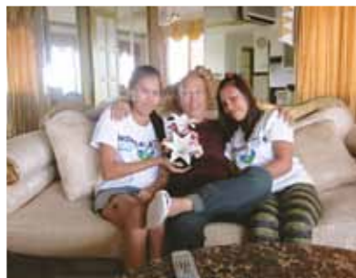
メイドさんに囲まれて幸せなひととき!毎月の会報で皆様からの体験談の通り、自然環境が誘うセブ島でした