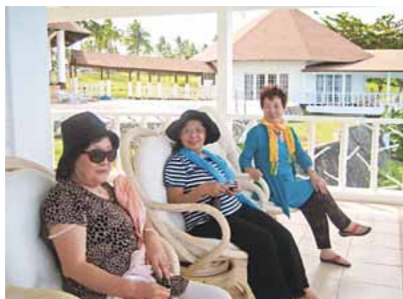
4年振りのセブ島、初めてカモテス島へ!島の人々のゆったりと静かな生活も見せていただき、シンプルな生活が一番幸せと実感しました

セブ島で初めてのお友達二人と御一緒に4年振りのセブ島旅行でした。他のお部屋の全室宿泊が決まっているとの事で、コーラルポイントリゾート・スペシャルビラに初めて泊まりました。すぐ目の前に海と一体に感じられるプールがあり、穏やかな海を眺めていると幸せな気分を味わうことが出来ました。ボホール島は地震の後でしたので残念ながら行くことが出来ませんが、今回初めてカモテス島へ。バンカーボートに乗り、波しぶき浴びながらも心地良い風に吹かれながらの船旅で、何と気持ちの良い時間だったことでしょうか!カモテス島の島の人々のゆったりと静かな生活も見せていただき、シンプルな生活が一番幸せと実感しました。帰りは夕陽がそれはそれは素晴らしく感動しました。パンダノン島でのバーベキューも美味しく、綺麗な海を眺めながらのゆったりとした時の流れ、これも又至福の一時でした。前回の時にハマったオイルマッサージも気持ち良くてこれも又至福の一時でした。3歳の孫が記憶に残る年齢に達したら、是非この環境を味わわせてあげたく、セブ島に連れて行けることを目標に頑張っ元気でいなければと思いました。今度はコーラルポイントリゾートで、ゆっくりのんびりゆったりと時間を過ごす、本当のセブ気分を味わってみたいと思います。お世話になりましたドライバーさん、ガイドさん、可愛いメイドさん本当に有難う御座いました。この様な素晴らしい体験をさせてくださる行方会長に感謝です。