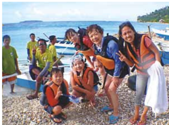
ジンベエザメと泳いだ夏、とってもいい思い出になりました！自分の3倍もある体を見ると、とってもビックリしました

ぼくのフィリピンリョこうで楽しかったことは、ジンベエザメを見に行ったことです。夜通し車で走って行きました。そして海岸ぞいのホテルで一泊しました。そして次の日、ジンベエザメを見に行けるところまで車で行きました。そして日本で買ったシュノーケルグッズをつけて海に行きました。そしてジンベエザメが見られるスポットまで行きました。海をのぞくとジンベエザメが見られました。漁師さんがジンベエザメのエサを船からあげていました。それをジンベエザメがすいこむように食べていました。そして海水だけをエラから出していました。そして海にもぐると、ジンベエザメがすぐ近くにいました。そしてとっても大きかったです。そしてジンベエザメがエサを食べるところを見るととっても大はく力でした。自分の3倍もある体を見ると、とってもビックリしました。ジンベエザメはとっても大きかったです。とってもいい思い出になりました。2つ目の楽しかった事は、フルーツスタンドがある市場に行ったことです。そしてフルーツスタンドとはフルーツがならべられているところです。そしてバナナやマンゴやスイカなどがありました。そこでマンゴスチンとマンゴを買いました。ほかにも市場なので、いろいろな物がありました。セブで食べたフルーツはどれも甘くてとってもおいしかったです。