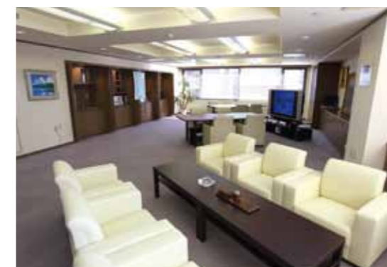
100平米の広々としたお客様専用サロン

ワールドビッグフォー入会のご案内、ご説明等、お客様にお寛ぎいただける専用サロンをご用意致しました。