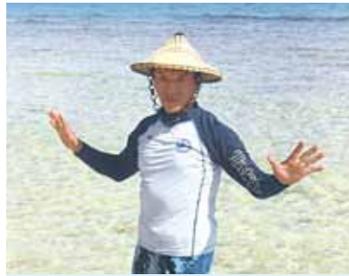
楽しい思い出、エキサイティングな観光、地震の恐怖を覚えた旅でした! 毎日遅くまで世話をしてくれたスタッフ全員に感謝、ありがとう!!