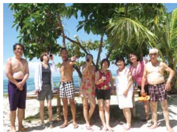
結婚をして50年(金婚式)お祝い旅行の実現に感謝! 一緒に行ったグループの皆様、又スタッフの皆様有難うございます

セブに行く1週間ほど前、足のスネを痛めてしまい動けなくなり、楽しみにしていたセブ旅行に行く事を諦めなくては行けないのか・・・と思いました。どんな事をしてもし楽しみにしていたセブ旅行、実は結婚をして50年(金婚式)になるので、そのお祝いにどんな事をしてでも行きたかったです。又4月には大腸ガンの手術をして、やっとセブに行けるほど身体も回復出来たのに・・・ところが足も痛いなりにもどうにか動けるようになり、17日お昼から出発しました。2度目のセブです。やはり足が痛いので自由に動く事が出来ず、皆様に助けていただき、ただただ感謝です。本当に一緒に行ったグループの皆様、又スタッフの皆様有難うございます。今度又元気がってセブに帰ってきます。何度でも行きたいセブ。