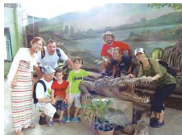
セブ旅行で日常生活から解放!ファミリーの楽しい思い出を積み上げることができて、感謝しております

ワールドビッグフォーとのお縁で、セブ島訪問の機会を得て、感謝しております。紅白のブーゲンビリア、真白のプルメリア、多様なヤシ類の素晴らしい景観、エメラルド色とサンゴで彩られた海での戯れ、マンゴ、マンゴスチンの美味しい味わい等、南国の自然の美しさ、豊かさを堪能し、日常生活から解放されました。ファミリーの楽しい思い出を積み上げることができて感謝しております。フィリピンは7,107の島が点在していることを知り、驚くとともに、この国の国土管理・統治の困難さを想像しました。コーラルポイントリゾートの北東方向のすぐ近くに、第二次世界大戦の激戦地の一つレイテ島があることを知り、思わず島に向かって手を合わせました。まさかその数日後に、歴史に残るスーパー台風ヨランダが通過するとは思ってもよらないことでした。情報が少なく台風の規模や被害の大きさを知ったのは帰国してからです。無事に帰国できたことに安堵したものです。今回の旅で垣間見ると、フィリピンは住宅・道路・上下水道・医療・教育など、社会資本の整備のための長期計画と安定財源の必要性を強く感じました。このような中で、フィリピンの地域振興に貢献する行方会長様、また自分達も行く事によってフィリピンの発展や国民生活の向上に少しでもお役にたてればいいなと感じたところです。最後に今回の台風の被害者の皆様のご冥福と一刻も早い再建をお祈り申し上げます。