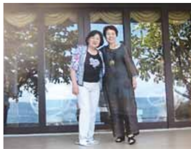
感謝!今度はコーラルポイントリゾートで、ゆっくりのんびりゆったりと時間を過ごす、本当のセブ気分を味わってみたいと思います