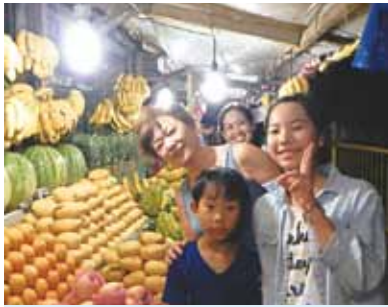
2つ目の楽しかった事は、フルーツスタンドがある市場に行ったことです！セブで食べたフルーツはどれも甘くてとってもおいしかったです