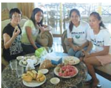
パティアンゴルフリゾートからの帰りに市場で買った果物でミニミニパーティー!ありがとうございました。楽しかったです