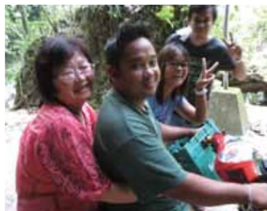
今回で2度目のセブも楽しめました! 何度でも行きたいセブ、今度又元気がってセブに帰ってきます