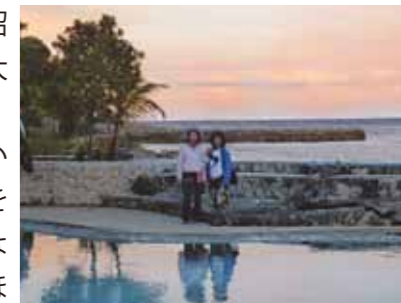
何か懐かしい思い出を呼び起こす様なこの度のセブ旅行、時代を経ての楽しい平和な時を本当にありがたく思います

小学校入学の時、支那事変(昭和12年)となり第二次世界大戦終戦の日、昭和21年8月15日のすべての10年間、思い起こせば学校生活で戦時教育を受けて育ちました。今の平和な時代には考えられない事は山ほどあります。体育の時間は鋤をかついでお芋畑に行き、畑の手入れ、収穫の時はお芋を掘り起こして人手不足になっている農家へお手伝い(男の人は戦争に出ている)。お裁縫の授業は兵隊さんのチョッキを編み棒で編んだりしていました。又兵隊さん達の宿舎では、真夏の暑い中、蚊帳の破れのつくろい(お外の暑い庭で)。戦争が無くなってからは疎開地へ(街は空襲で爆弾を落とされるので)。電気も水道もない山を越えて田舎の方へ行き住んでいました。家の近くに蛇がでてきたり、アヒルやガチョウに追いかけられたりした事は、懐かしい思い出です。戦時中フィリピンは激戦地で、当地の方々にはさぞ大変な思いをされた事と忖われます。この度のセブ旅行、時代を経ての楽しい平和な時を本当にありがたく思います。セブでの美しい海、景色、当地の方々のご親切なおもてなし、至福の数日を過ごさせていただき、感謝申し上げます。