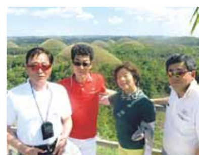
セブ最高! 連日好天に恵まれ、ボホール島観光も最高でした。今回思い切って参加して本当に良かったと思えました!

以前よりフィリピンへ行ってみたいと思っておりましたが、なかなか行く機会が無いままでおりました。この度、ワールドビッグフォーの入会を切っ掛けにセブ行きを計画することが出来ました。セントレア(中部国際空港)からの直行便ということで客席も半分以上が空席という状況。ゆっくりと横になることが出来、幻想的な夕日に迎えられ無事マクタン・セブ国際空港に到着しました。今回4名の仲間は