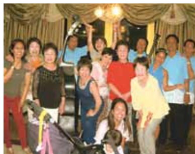
メイドさんが可愛い笑顔で迎えてくれて、4泊5日の旅はコーラルポイントリゾートで思いっきり楽しもうと思いました!