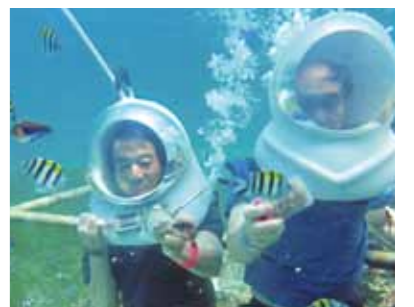
初めてのシーウォーカーは、本当に良い経験となりました!色鮮やかな熱帯魚に触れ、南国の海中の一端を見る事ができました!

今回はカモテスリゾート、バディアンゴルフリゾートにも宿泊し、新たな体験を沢山させていただきました。眠りを誘う心地良いエンジン音を体を感じ、じかに南国の海の波と風に触れ、ボートで島々を眺めながらのバンカーボートでのカモテス島への往復。静かで透明な青い海を前にスタッフから心を込めて作っていただいた食事の美味しかったこと。本当に癒しの一時でした。渋滞のセブ市内、曲がりくねった山道と日本にもある風景ですが、バディアンゴルフリゾートまでは長かった。そして森を抜けるとパッと広がる海。「ここにもこんな素晴らしいリゾートが…!」次は「ゆっくりと下手なゴルフでも」と思っていました。それにしても、カワサン滝では死ぬかと思った“筏での滝打ちマッサージ!?”もう一度で充分と…!初めてのシーウォーカーは、泳げなく水の嫌いな私には大変な恐怖でした。しかしインストラクターの丁寧な誘導に安心して色鮮やかな熱帯魚に触れ、南国の海中の一端を見る事ができ、本当に良い経験となりました。さらに様々な美味しいフィリピン料理を味わい、セブの歴史を知る観光スポットの見学など、沢山の体験をすることができました。これも多くのスタッフの支えのおかげと心より感謝しております。今回の旅を通して、改めてワールドビッグフォーの理念のすばらしさとその理念の確かな遂行を実感することができました。本当にありがとうございました。