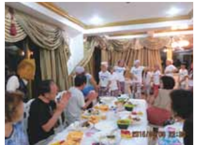
パーティーはとても楽しく、お腹の皮がよじれる程笑いました!お祭りには欠かせないという「子豚の丸焼き」がテーブルに並んでいるのには驚きました!

「セブにはいつ行けるの?」一緒に行く方々との日程調整が何度かされて、ようやく6月に決まり、この日を心待ちにしていました。コーラルポイントリゾートに到着したのは夜でした。可愛いメイドさん達が、素敵な笑顔で出迎えてくれました。JWBホテル見学では、日本人学生に出会いました。語学留学終了後は、英語や留学の経験を活かす職業に就きたいと力強く話していました。カモテス島は、少し遠かったのですが、とても綺麗なところでした。帰りにはイルカの群れを見る事ができました。バディアンでは、カワサン滝に打たれて来ました。狭くてデコボコした道を走るバイクに恐怖を感じながら走ったり、打ち砕かれそうな滝の強さに耐え頑張りました。待望のパラセーリングやシーウォーカーも初めての体験でした。最後の夜のパーティーはとても楽しく、お腹の皮がよじれる程笑いました。お祭りには欠かせないという「子豚の丸焼き」がテーブルに並んでいるのには驚きました。セブ旅行では、4つのリゾート施設を見たり利用させて頂きました。大好きなマンゴーを毎日食したことや、欲しかったお土産を買うことも出来ました。そして、何よりもお世話して下さったセブのスタッフの方々に心から感謝します。ありがとうございました!