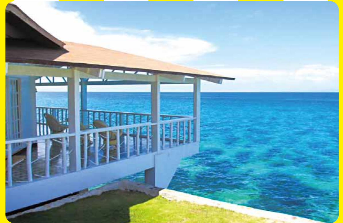
美しい珊瑚礁の景観に包まれた究極の楽園・カモテスリゾート