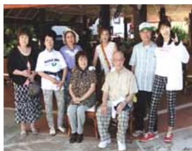
カオハガン島には今年も行き、鮮やかで綺麗で大きなキルトを買ってきました! 毎年どんなキルトが出来上がっているのか楽しみです