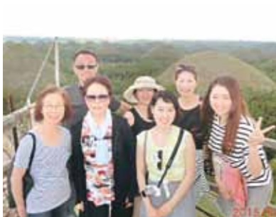
パンダノン島でのバーベキューやホボール島での船上ランチ。毎日ショッピング、エステとぜいたく三昧。最高に幸せな旅ができました!