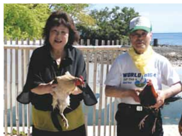
今年も年に一度、9日間のバカンスを心ゆくまで楽しんで、太陽をいっぱいあびて、(肌にはダメージかも)リラックスした日々をすごして来ました

今年は4月ではなく、5月のセブに行きました。コーラルポイントリゾートに行く途中に大きなビルが建築中でびっくりしました。マクタン島はどんどん発展しています。コーラルポイントリゾートに到着、いつものように「ただいま」メイドさんたちの「お帰りなさい」う～ん、いい響きです。ゆったりと、8泊9日の旅が始まりました。4年ぶりにボホール島に行きました。かわいいターシャやチョコレートヒルを見て回りました。地震で壊れた建物が痛々しく見えました。今年も年に一度、9日間のバカンスを心ゆくまで楽しんで、太陽をいっぱいあびて、(肌にはダメージかも)リラックスした日々をすごして来ました。パーティーではとっても怖そうでおいしそうなお肉の丸焼きを食べて、あつと言う間の日々を過ごしました。ワールドビッグフォー様のお陰です。また1年頑張つて、来年もセブに出かけたいと思います。ありがとうございました。