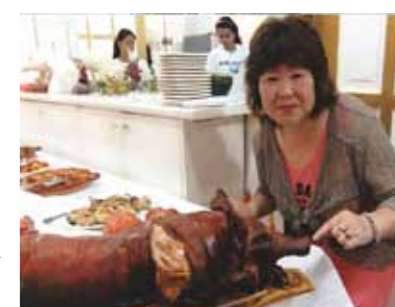
パーティーではとっても怖そうでおいしそうなお肉の丸焼きを食べて、あつと言う間の日々を過ごしました。来年もセブに出かけたいと思います

今年は4月ではなく、5月のセブに行きました。コーラルポイントリゾートに行く途中に大きなビルが建築中でびっくりしました。マクタン島はどんどん発展しています。コーラルポイントリゾートに到着、いつものように「ただいま」メイドさんたちの「お帰りなさい」う～ん、いい響きです。ゆったりと、8泊9日の旅が始まりました。4年ぶりにボホール島に行きました。かわいいターシャやチョコレートヒルを見て回りました。地震で壊れた建物が痛々しく見えました。今年も年に一度、9日間のバカンスを心ゆくまで楽しんで、太陽をいっぱいあびて、(肌にはダメージかも)リラックスした日々をすごして来ました。パーティーではとっても怖そうでおいしそうなお肉の丸焼きを食べて、あつと言う間の日々を過ごしました。ワールドビッグフォー様のお陰です。また1年頑張つて、来年もセブに出かけたいと思います。ありがとうございました。