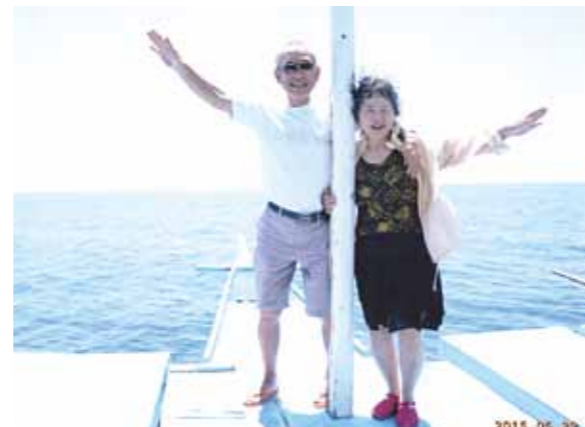
バンカーボートでカモテス島へ行きました!写真通りの素敵な建物と中は広く豪華なお部屋♪二人じゃもったいないようだ!

今までは、冬にセブへ行っただけですが、今回は夏。なんとなく荷物も軽いようなウキウキ気分が日本を後にしました。コーラルポイントリゾートに着くと、メイドさんが大好きなマンゴジュースとオイルマッサージで迎えてくれました。夜でしたので海を見る事は出来ず残念でした。翌朝はゆっくり起きると、きれいな海、ピンク、白のブーゲンビリア、ヤシの木がたまらない美しさ。朝食を済ませ、バンカーボートでカモテス島へ行きました。写真通りの素敵な建物と中は広く豪華なお部屋♪二人じゃもったいないようだ。夕食後プールへ入ったら、温かくて温泉に入っている様で気持ちよかったです。その晩はカモテスリゾートで一泊しました。翌朝はティモボ洞窟観光、ホワイトビーチへ行って海へ入った。泳げないけど、泳ぐまねをして楽しかった。次の日は、パンダノン島へ行った。今日も海遊びで陽にやけた。フィリピンは島だらけで、島の名前が覚えられない。5日目は早めに朝食を済ませてボホール島へ。ロボク川下りをしたり、メガネザルのターシャを見に行った。ターシャが黒く小さくてよく見えなくて残念だった。6日目は、デパートへお買い物に行き、明日の帰国の用意をしました。夕方から行方会長様からの御好意でお別れパーティーをしていただいた。食べたり、笑ったり、踊ったりと、6泊7日の楽しい旅は終わりました。コーラルポイントリゾートの皆様、御一緒されました皆様、有難うございました。楽しい旅でした。