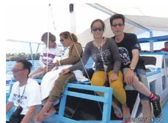
連日観光の日程で昼夜を問わずセブを満喫! 特に初めてのカモテス島にも行って気持ちの良い船旅も体感! 楽しく過ごさせて頂きました