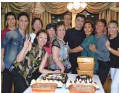
「さよならパーティー」では、豪華な食事に生のバンド演奏。踊って笑って最高に盛り上がりました!