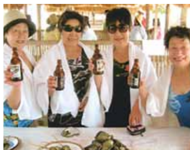
私達4名の貸切りで、パンダノン島まで船で1時間!バーベキューは、沢山の肉、チキン、イカ、ビール等を提供して頂き大満足!