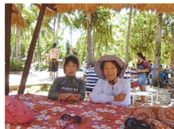
平和で楽しいセブ旅行!美しい海、景色、当地の方々のご親切なおもてなし、至福の数日を過ごさせていただき、感謝申し上げます

小学校入学の時、支那事変(昭和12年)となり第二次世界大戦終戦の日、昭和21年8月15日のすべての10年間、思い起こせば学校生活で戦時教育を受けて育ちました。今の平和な時代には考えられない事は山ほどあります。体育の時間は鋤をかついでお芋畑に行き、畑の手入れ、収穫の時はお芋を掘り起こして人手不足になっている農家へお手伝い(男の人は戦争に出ている)。お裁縫の授業は兵隊さんのチョッキを編み棒で編んだりしていました。又兵隊さん達の宿舎では、真夏の暑い中、蚊帳の破れのつくろい(お外の暑い庭で)。戦争が無くなってからは疎開地へ(街は空襲で爆弾を落とされるので)。電気も水道もない山を越えて田舎の方へ行き住んでいました。家の近くに蛇がでてきたり、アヒルやガチョウに追いかけられたりした事は、懐かしい思い出です。戦時中フィリピンは激戦地で、当地の方々にはさぞ大変な思いをされた事と忖われます。この度のセブ旅行、時代を経ての楽しい平和な時を本当にありがたく思います。セブでの美しい海、景色、当地の方々のご親切なおもてなし、至福の数日を過ごさせていただき、感謝申し上げます。