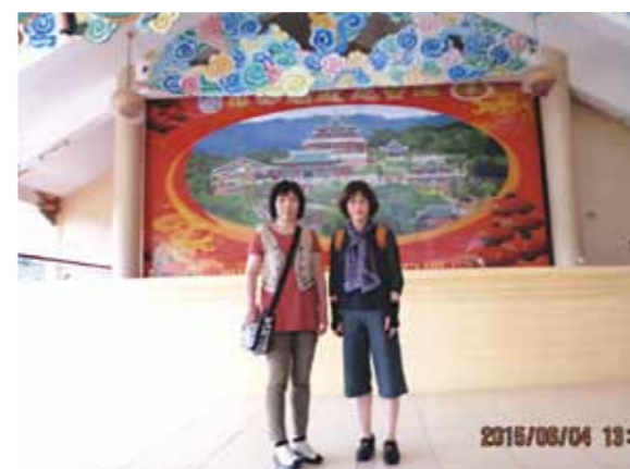
ありがとうございました!待望のパラセーリングやシーウォーカーにも挑戦!大好きなマンゴーを毎日食し、欲しかったお土産を買うことも出来ました!

「セブにはいつ行けるの?」一緒に行く方々との日程調整が何度かされて、ようやく6月に決まり、この日を心待ちにしていました。コーラルポイントリゾートに到着したのは夜でした。可愛いメイドさん達が、素敵な笑顔で出迎えてくれました。JWBホテル見学では、日本人学生に出会いました。語学留学終了後は、英語や留学の経験を活かす職業に就きたいと力強く話していました。カモテス島は、少し遠かったのですが、とても綺麗なところでした。帰りにはイルカの群れを見る事ができました。バディアンでは、カワサン滝に打たれて来ました。狭くてデコボコした道を走るバイクに恐怖を感じながら走ったり、打ち砕かれそうな滝の強さに耐え頑張りました。待望のパラセーリングやシーウォーカーも初めての体験でした。最後の夜のパーティーはとても楽しく、お腹の皮がよじれる程笑いました。お祭りには欠かせないという「子豚の丸焼き」がテーブルに並んでいるのには驚きました。セブ旅行では、4つのリゾート施設を見たり利用させて頂きました。大好きなマンゴーを毎日食したことや、欲しかったお土産を買うことも出来ました。そして、何よりもお世話して下さったセブのスタッフの方々に心から感謝します。ありがとうございました!