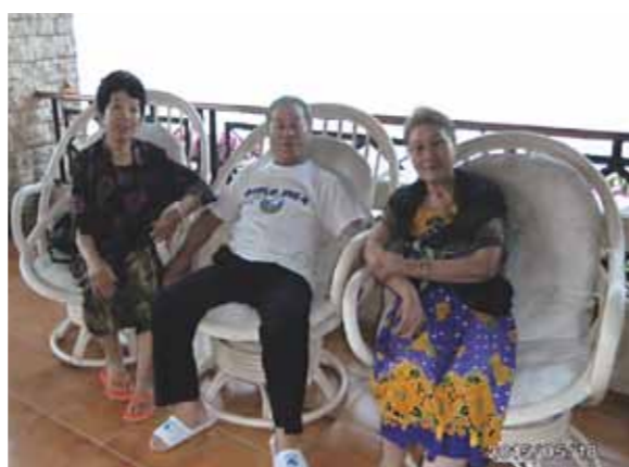
今年で私にとってセブ旅行は、早くも9回目! 仲間と共に8名で、今年もゆっくりと過ごさせていただきました!

今年で私にとってセブ旅行は、早くも9回目となりました。今年も8泊9日で仲間と共に8名で行って参りました。初めて行った頃比べるとセブ市内の車も景色もずいぶん変わりました。発展途上中のセブには毎年驚かされます。年に一度のセブ旅行、今年もゆっくりと過ごさせていただきました。昨年も行ったカオハガン島には今年も行き、鮮やかで綺麗で大きなキルトを買ってきました。毎年どんなキルトが出来上がっているのか楽しみです。毎日のプールに美味しい食事。今年もとても楽しい旅になりました。セブにいても、日本にいても、ワールドビッグフォー様には感謝でいっぱいです。ありがとうございました。