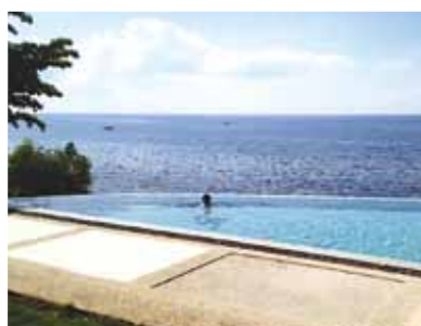
あまりにも見事な宿泊施設! 朝は釣り舟と朝日を眺めモーニングコーヒーを頂き夢心地! 海を独り占めにした気分になりました