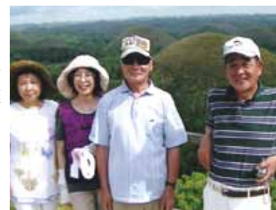
3日目はボホール島へ! チョコレートヒルでは不思議な世界体験♡可愛いメガネザル(ターシャ)が大きな目を開き出迎えてくれました!

私をワールドビッグフォーに誘って下さった息子嫁のご両親と4泊5日のセブ旅行です。長野から金沢に泊まり、金沢から私達4人で中部国際空港へマイカーで行き、セブ旅行が始まりました。マクタン・セブ空港に着くとガイドさんが笑顔で出迎え、ワールドビッグフォーのリゾート施設に向かいました。その晩は日本から持って来た“そうめん”を頂き、マンゴーを食べ放題食べ、美味しく満足しました。パندان島にてバーベキュー、ブルーの海で海水浴、真っ白い砂浜で波と砂遊び。セブの大自然を満喫した。3日目はボホール島へ、ロボク川での船上バイキングを楽しみ、途中原住民のお出迎え? 小さい子供達の民族おどり、チョコレートヒルでは不思議な世界を見た感じでした♡可愛いメガネザル(ターシャ)は夜と間違えたのかの様に大きな目を開き出迎えてくれました。4日目、マリンスポーツではジェットスキーに2人で乗り、青春時代に返った様な気分で大変スリルがあり楽しく過ごしました。日本人インストラクターの娘さん有難うございました。真っ青に晴れ渡る空、どこまでも広がるコバルトブルーの海、目の前に広がる感動! 美味しいマンゴーやバナナ、パイナップル。マンゴジュースは濃厚で幸せな味は忘れられません。天候にも恵まれ、楽しい4泊5日のセブ旅行でした。ガイドさんやドライバーさん、そしてメイドさん、大変お世話になり有難うございました。心から感謝申し上げます。