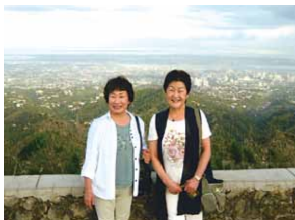
セブ市を一望出来る高い山(トプス)にて、セブの町には、子供、若者、オートバイ、車の多いことにおどろき、乗り合いバスの多いのにもビックリ!

初めてのセブ島、出発まではとても不安がりましたが、海外旅行慣れの方が二人居ましたので、おんぶに、だっこで楽しい旅になりました。成田空港を出発して、マクタン・セブ国際空港に着く前の飛行機の中から素晴らしい夕焼けを見る事が出来ました。セブ空港に着き、まずはガイドさん、ドライバーさんを見つけ安心した気持ちで迎えに来た車に乗る事が出来ました。メイドさんが可愛い笑顔で迎えてくれて、4泊5日の旅はコーラルポイントリゾートで思いっきり楽しもうと思いました。セブに行って来た人から「マングジュース美味しいよ」と聞いていました。さすが、とてもとても毎日おいしくいただきました。次の日は1時間船に乗り、海のきれいなのに感動し、船を下りてからは用意してくれた焼肉、海魚、ビール他いろいろ用意していただき、おいしくいただき、エメラルドグリーンの海で水着になり、みんなで童心にかえったように燥ぎました。船頭では、映画タイタニックのワンシーンの経験もしました。カジノでは初めての機械に運良くつかまり、ラッキーでした。エステサロンでは、最高にリラックスのできた時間でした。セブの町には、子供、若者、オートバイ、車の多いことにおどろき、乗り合いバスの多いのにもビックリしました。フィリピンの歴史のあるお寺、セブ市を一望出来る高い山(トプス)、ショッピングと色々な所に連れて行って頂きました。セブのスタッフの皆さんに、とても良くしていただき、ありがとうございました。感謝申しあげます。