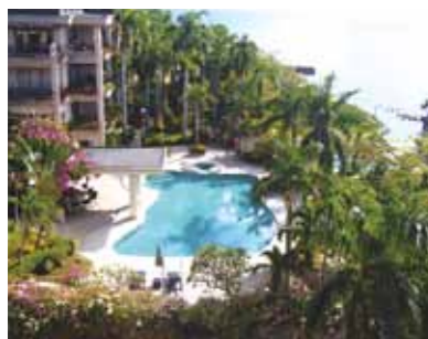
コーラルポイントリゾートのプールで“ゆっくり、のんびり”花々が咲きみだれる南国のやさしい風に吹かれて…幸せな時間を過ごせました