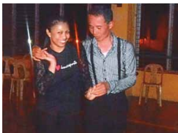
ゴールデンウィークを利用して2回目のセブへ! 今回は晴天続きで南国ムードを満喫。日常の喧騒を忘れさせてくれて心もからだも癒された

今年は運よくゴールデンウィーク前半に休暇が取れて、2回目のセブ旅行に行く事になった。前回1月は、肌寒い曇り空が多かったが、今回は晴天続きで南国ムードを満喫する事が出来ました。2日目は、前回波の状態が悪く船で行けなかった念願のカモテス島へバンカーボートで繰り出した。真夏の太陽が照りつける深いコバルトブルーの穏やかな海の上を風が渡り滑るように走るボート。遠くに見える入道雲、時折姿を見せるイルカの群れなどを眺めながらの船旅は、日常の喧騒を忘れさせてくれて心もからだも癒された。カモテス島が近づくにつれて、海の透明度が増してきた。そして珊瑚の岸壁に建つ地中海風の白亜の別荘はヤシの木とプールに囲まれて、透明なエメラルドグリーンの海を見下ろす高台に建てられていた。ここで昼食のバーベキューを頂いた。海をそよぐ風を感じながら炭火焼の地鶏やカツオ、エビ、イカの煮付けなど地元料理をリッチな気分で頂いていると、脳裏にはジュディー・オングの「魅せられて」の一節“Wind is blowing from the Aegean”が流れていた。腹ごなしに魚と一緒にひと泳ぎした後、帰りのボートでは“ウトウト”眠りに落ちた。目が覚めるとコーラルポイントリゾートに日が落ちかけて、夕陽がヤシの木の向こうの水平線を赤く染めていた。