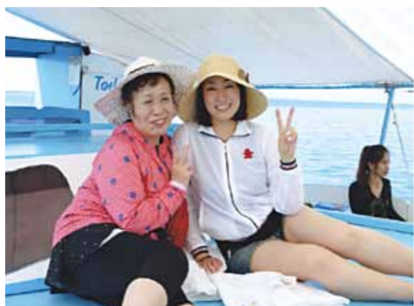
念願の母との海外旅行!自分にとっても、色々な方々との出会い、発見のあった素晴らしい5日間でした。最後に私を連れてきてくれた母へ...本当にありがとう!

念願の母との海外旅行が、今回のセブで実現しました。深夜にも関わらずメイドさんが笑顔でお出迎え。広いリビングは開放感抜群!お好みのベッドルームで就寝。翌朝カーテンを開けると、真夏の太陽にきらめく海が広がるオーシャンビューの美しい景色が目の前に...そんな景色を見ながら、毎朝メイドさんお手製の朝食で1日が始まる。なんて贅沢な時間でしょう。天気を見て、毎日の予定を決める事ができる旅は、ガイドのリサさん、ドライバーのベルナルドさんがいつもサポートしてくれるからです。バンカーボートで行ったカモテス島では、お魚やお肉のランチにとりたてのヤシの実のジュースに、手作りのお料理を美味しくいただきました。食後は海が見えるプールでヨガポーズ!帰りは夕陽を見ながら時間がゆっくり流れました。夜は社交ダンスが好きな母と仲間とディスコへ...初のセブナイト、ダンサーの優しいリードで気付けば3時間踊りっぱなしの私!晴天の日は、パラセーリングに挑戦。セブ本島・マクタン島が一望でき、まるで鳥になった気分でした。最終夜は「さよならパーティー」が開催され、豪華な食事に生のバンド演奏。ガイドさんの誕生日のお祝いも兼ねて踊って笑って最高に盛り上がりました!毎日笑顔で沢山のサポートしてくれたスタッフの皆様に心から感謝したいです。自分にとっても、色々な方々との出会い、発見のあった素晴らしい5日間でした。最後に私を連れてきてくれた母へ...本当にありがとう!