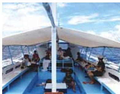
念願のカモテス島へ繰り出した! 海をそよぐ風にリッチな気分、脳裏にはジュディー・オングの「魅せられて」の一節が流れていた