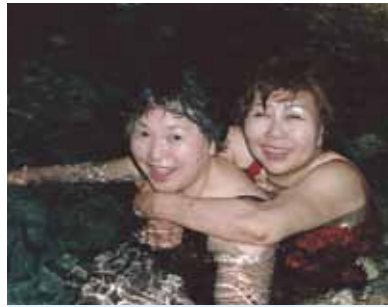
カモテスリゾートで一泊!翌朝はティモボ洞窟観光、ホワイトビーチへ行って海へ入った。泳げないけど、泳ぐまねをして楽しかった!