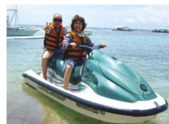
マリンスポーツではジェットスキーに2人で乗りピースサイン! 青春時代に返った様な気分で大変スリルがあり楽しく過ごしました

私をワールドビッグフォーに誘って下さった息子嫁のご両親と4泊5日のセブ旅行です。長野から金沢に泊まり、金沢から私達4人で中部国際空港へマイカーで行き、セブ旅行が始まりました。マクタン・セブ空港に着くとガイドさんが笑顔で出迎え、ワールドビッグフォーのリゾート施設に向かいました。その晩は日本から持って来た“そうめん”を頂き、マンゴーを食べ放題食べ、美味しく満足しました。パندان島にてバーベキュー、ブルーの海で海水浴、真っ白い砂浜で波と砂遊び。セブの大自然を満喫した。3日目はボホール島へ、ロボク川での船上バイキングを楽しみ、途中原住民のお出迎え? 小さい子供達の民族おどり、チョコレートヒルでは不思議な世界を見た感じでした♡可愛いメガネザル(ターシャ)は夜と間違えたのかの様に大きな目を開き出迎えてくれました。4日目、マリンスポーツではジェットスキーに2人で乗り、青春時代に返った様な気分で大変スリルがあり楽しく過ごしました。日本人インストラクターの娘さん有難うございました。真っ青に晴れ渡る空、どこまでも広がるコバルトブルーの海、目の前に広がる感動! 美味しいマンゴーやバナナ、パイナップル。マンゴジュースは濃厚で幸せな味は忘れられません。天候にも恵まれ、楽しい4泊5日のセブ旅行でした。ガイドさんやドライバーさん、そしてメイドさん、大変お世話になり有難うございました。心から感謝申し上げます。